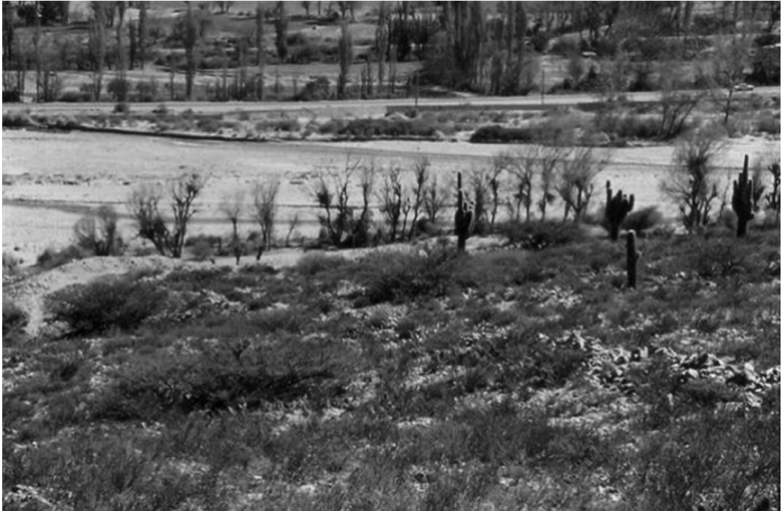
FIGURA 2 • VISTA DEL SITIO ALTO DE LA ISLA

ría de los sitios en terraza de Quebrada de Humahuaca, más allá de las viviendas no se presentan otras áreas funcionales (Rivolta 2005, Nielsen 2001, Nielsen et al 2004).