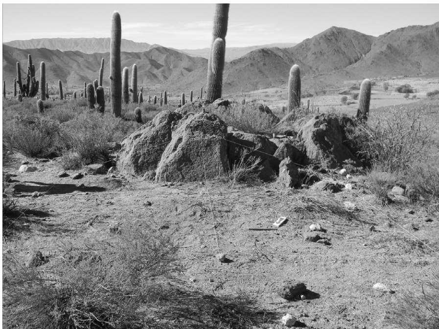
Figuras 4. Roca con cochas en Espacio de Congregación de Las Pailas. Escala: 30 cm.