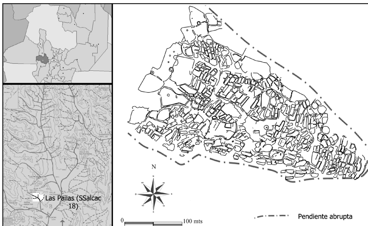
Figura 1. Izquierda: departamento de Cachi (Salta) y Valle Calchaquí Norte. Derecha: plano de Las Pailas (SSalcac 18).

del sitio. Se compone de 526 estructuras dispuestas siguiendo un patrón aglomerado (Figura 1).