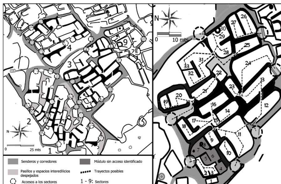
Figura 8. Izquierda: sectores de Las Pailas y distribución de accesos. Derecha: sector tres, accesos y detalle de circulación interna.

que la organización socio-política de las comunidades que habitaban la región estaba caracterizada por la integración social, la homogeneidad y la construcción de una vida social no estratificada (Acuto 2007, 2008; Acuto et al. 2008). Como mencionáramos con anterioridad, nuestra perspectiva teórica se centra en las prácticas, la interacción y las experiencias de la gente en el pasado, así como también en la incidencia que la materialidad y la espacialidad tienen sobre la vida social y la constitución de los sujetos (Bourdieu 1997, 1999; Lefebvre 1991; Miller 1987). Hasta el momento, hemos puesto a prueba estos conceptos mediante numerosos trabajos en el área de estudio que nos han permitido señalar una serie de tendencias sobre el habitar y la vida cotidiana en un poblado tardío, donde la homogeneidad material y de la experiencia espacial, propiciaban relaciones de semejanza y unidad.