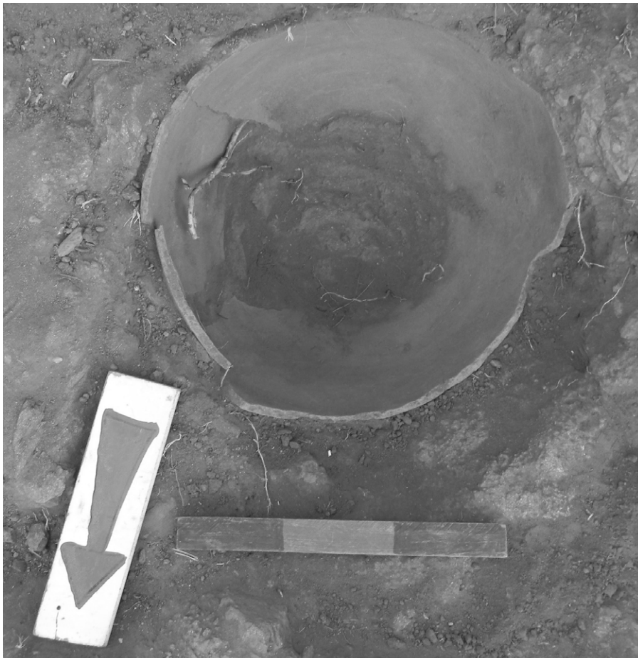
Figura 3. Silo sin revestimiento. Escala: 30 cm.