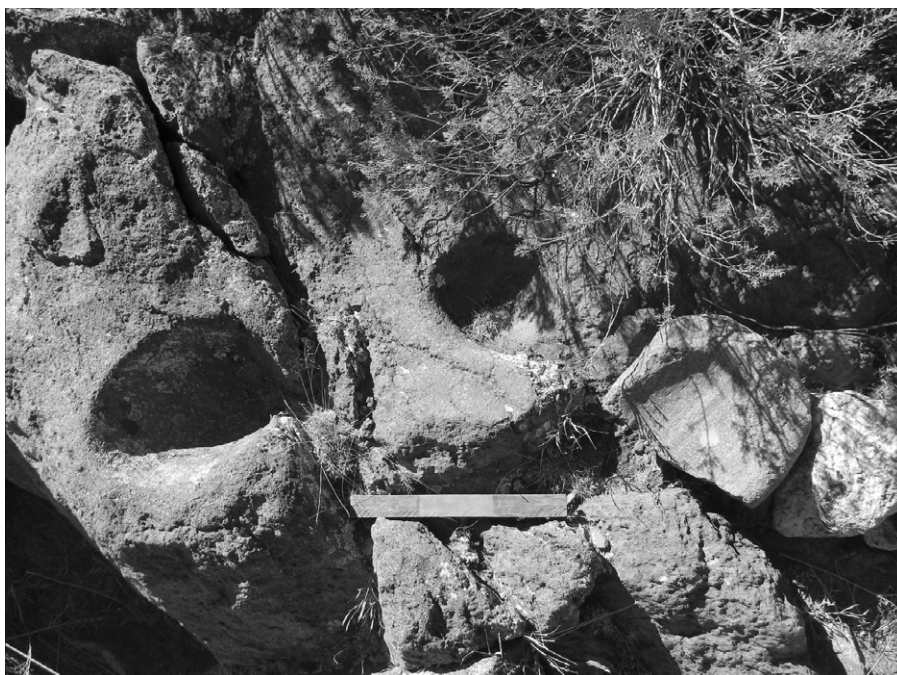
Figura 5. Cochas. Escala: 30 cm

Las Pailas representa un ejemplo particular dentro de lo que hemos observado en la zona. Si bien el patrón de asentamiento también es de tipo celular conglomerado, los recintos en este sitio no son semisubterráneos y sus muros no se construyeron a partir del revestimiento con rocas de los perfiles dejados por los pozos cavados. En Las Pailas la construcción de las estructuras se realizaba con muros de piedras (pirca seca) que se levantaban desde la superficie del suelo hacia arriba. Estos muros