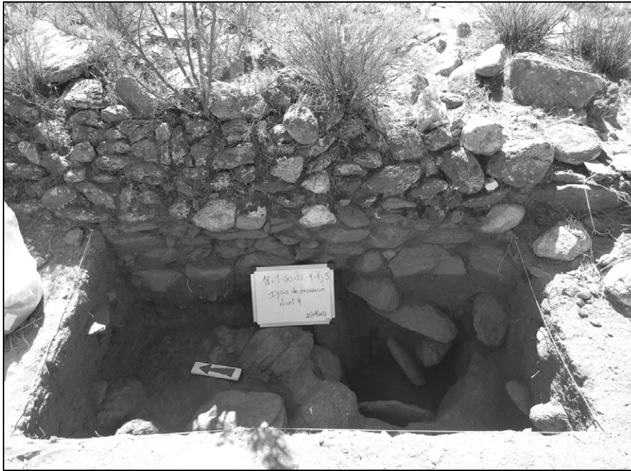
Figura 2. Silo revestido con lajas.