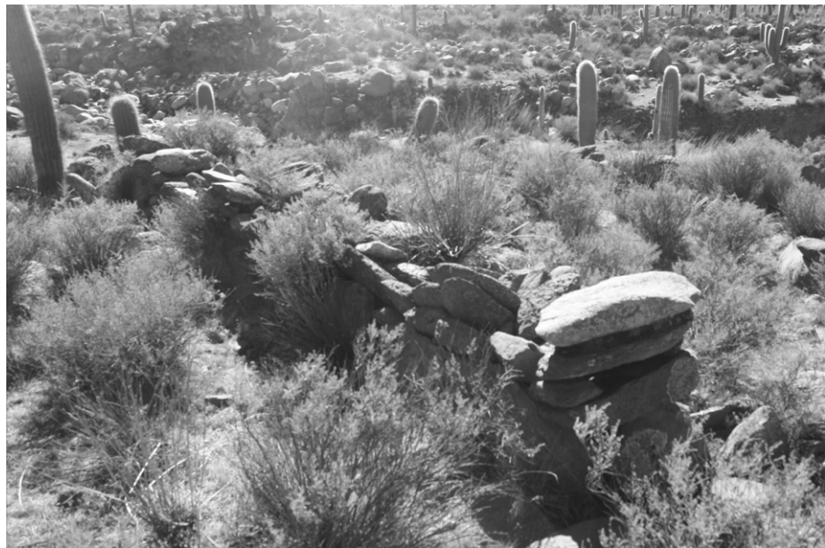
Figura 6. Segmento de muro doble y acceso hacia el vértice inferior derecho.

fueron confeccionados a partir del encastre de rocas tabulares de modo oblicuo sin argamasa. Si bien en Las Pailas las vías de circulación también quedaban definidas por los espacios interedilicios, a diferencia de los sitios arriba mencionados, estos senderos no eran sobreelevados sino que la circulación tenía lugar entre paredes elevadas que delimitaban pasillos (Figura 6).