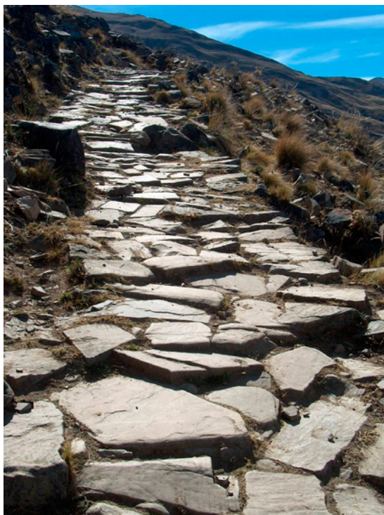
Figura 2. Detalle de tramos empedrados del camino incaico que une Santa Ana con Valle Colorado.