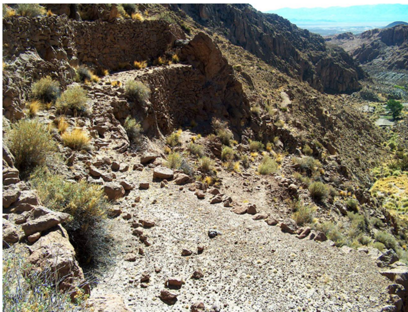
Figura 3. Andenes en anfiteatro sobre una pendiente cercana a los 45° en Puerta de Tucute, Casabindo.

Entre Potrero y Río Blanco se ubica una serie de quebradas con andenería que muestran diferentes tecnologías vinculadas con el momento inca, entre las que se encuentran acequias tapizadas en laja y otras que corrían por encima de paredes arrimadas a rocas o paredones rocosos. Río Negro abarca una serie de afluentes que presentan obras agrícolas prehispánicas entre las cuales se encuentra Puerta de Tucute, cuyo faldeo norte es íntegramente de desarrollo estatal, incluye andenes en anfiteatro y uno de dimensiones ciclópeas (Figura 3). En la cuenca media de Río Blanco, al sur, también se registran sectores con andenería, no obstante se carece de un reconocimiento exhaustivo de este sector. Al sur de dicho espacio no se han identificado desarrollos agrícolas de envergadura, solamente sectores muy reducidos en la zona de Alfarcito, localidad cercana a Rinconadillas.