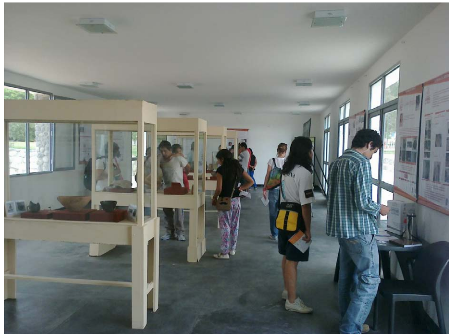
Figura 10. La muestra contó con una fluida asistencia, siendo el 95% de los visitantes de la localidad de Cafayate.