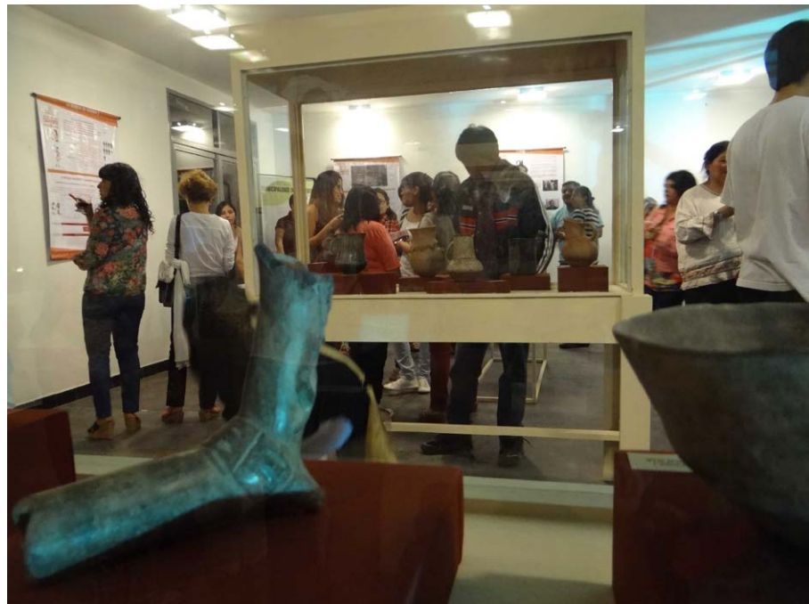
Figura 9. Inauguración de la muestra con la participación de los vecinos de la Banda de Arriba, investigadores, montajistas y autoridades municipales.