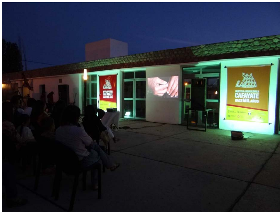
Figura 8. Vista externa del salón con la proyección del documental durante la inauguración (sector externo del salón).