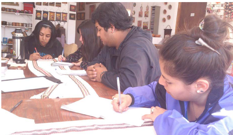
Figura 2. Confección previa de agendas conversacionales consensuadas por los estudiantes de Ciencias de la Comunicación y Arqueología.

A partir de los datos relevados se logró llegar a un momento inicial óptimo del plan de comunicación ya que se contó con la opinión de los participantes. A partir de este cimiento informacional se definieron los temas de la muestra, el isologotipo y su tipografía, las piezas a exponer, sus elementos identitarios, el alcance, el lugar, los soportes de comunicación necesarios para difundir su lanzamiento y otros parámetros necesarios para la planificación.