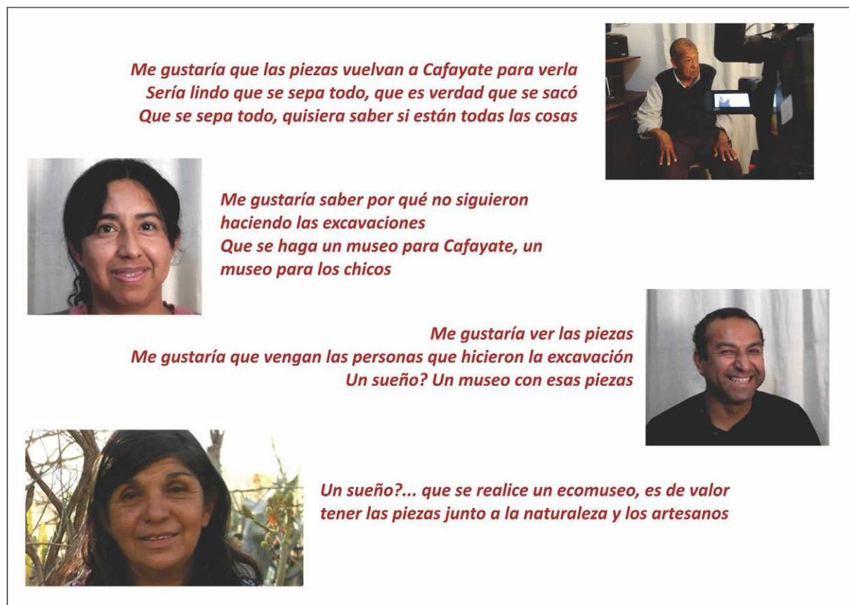
Figura 5. Detalle de uno de los apoyos museográficos de la muestra "Cafayate hace mil años", donde se pueden observar algunas de las frases mencionadas por los vecinos de la Banda de Arriba.

El salón fue utilizado como un espacio abierto y libre de divisiones donde conviven las vitrinas con los bienes arqueológicos, las instalaciones y la cartelería. Si bien las vitrinas y la cartelería fueron organizadas de manera temática (por sitio y hallazgos arqueológicos), el recorrido era libre lo que permitió a los visitantes desplazarse en forma independiente. A los fines de organizar el ingreso, fundamentalmente con las delegaciones de estudiantes, se habilitaron puertas de ingreso y salida.