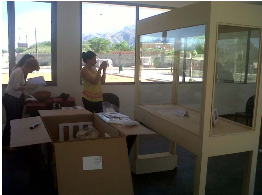
Figura 7. Montaje de la muestra arqueológica "Cafayate hace mil años".

Finalmente, durante el acto inaugural las autoridades municipales se hicieron eco de la necesidad de contar con un museo de arqueología de gestión estatal en Cafayate. Si bien se puede considerar una respuesta de tipo política, hasta el momento no se había generado la necesidad del producto museo arqueológico en Cafayate por parte de la localidad y el pedido concreto a las autoridades.