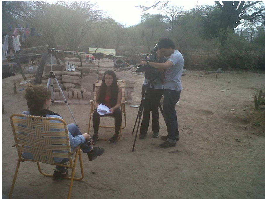
Figura 3. Entrevistas en la Banda de Arriba con registro audiovisual.

La intención fue desplazar la atención del objeto arqueológico al sujeto de la muestra y mostrar al “denunciante/descubridor” del hallazgo, a los colaboradores durante los rescates y a los vecinos, entre otros. Los entrevistados expresaron de manera recurrente su interés en conocer la ubicación de los hallazgos efectuados en cada uno de los lotes del paraje La Banda de Arriba, los motivos por los cuales los bienes se encuentran en Salta y el pedido de la realización de un museo arqueológico de gestión pública 3 en la misma ciudad de Cafayate.