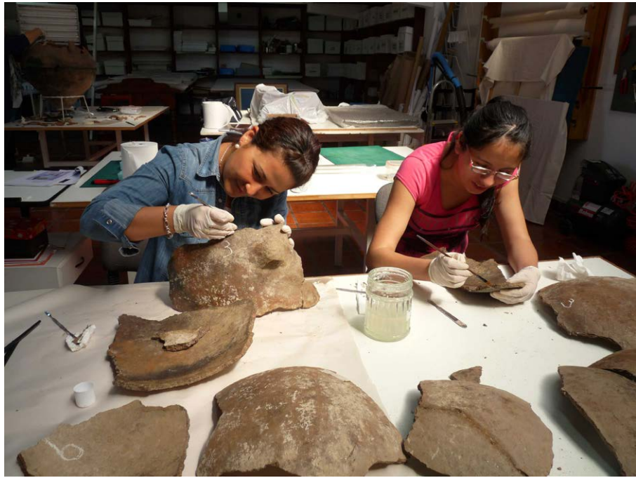
Figura 6. Tareas de restauración de las vasijas arqueológicas a ser expuestas y provenientes de La Banda de Arriba (Departamento de Restauración y Conservación de la Dirección General de Patrimonio Cultural de la Provincia de Salta).