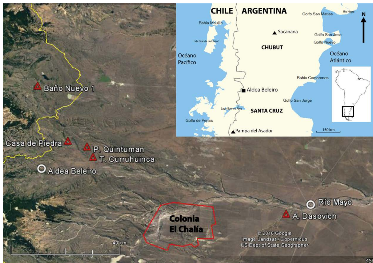
Figura 1. Mapa del área con los sitios arqueológicos mencionados en el texto.

la presencia predominante de guanaco ( Lama guanicoe ), algunos restos de oveja (sólo en los estratos superiores), huemul ( Hippocamelus bisulcus , en capas 4 y 6) y restos de aves mediano/pequeñas.