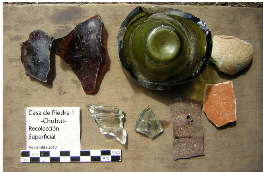
Figura 3. Parte del material “europeo/criollo” de superficie de CP1.

de este ideal, los inmigrantes europeos aparecían como los deseados, frente a los no deseados representados por chilenos y pobladores tehuelches y mapuches (Baeza, 2007). Esta política estatal, luego de la “Campana del Desierto”, tuvo como objetivo afianzar la presencia nacional en la frontera con Chile, para lo cual contó con el accionar de los inspectores de tierras, funcionales al discurso nacional de principios del siglo XX, quienes fueron los encargados de sugerir o no el otorgamiento de la propiedad de las tierras; de esta forma se fueron construyendo las diversas representaciones acerca de los habitantes de la frontera (Baeza, 2007; Del Río, 2010).