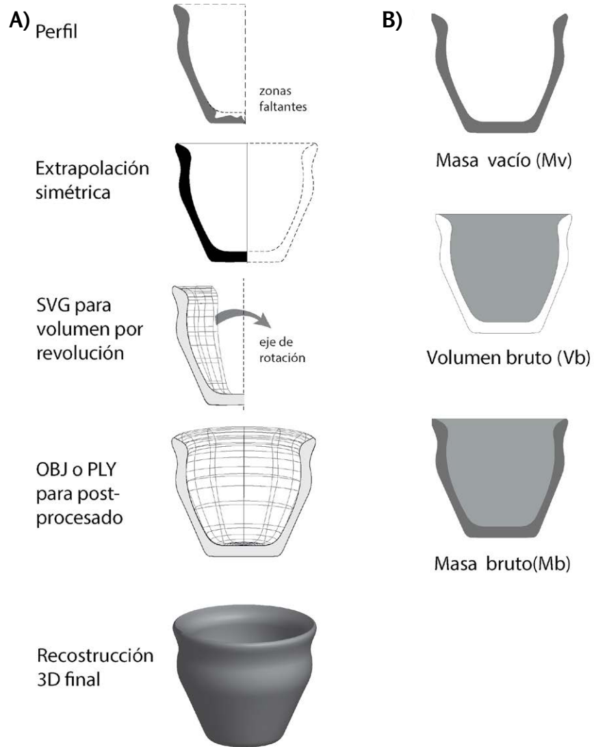
Figura 3. A) Esquematización del trabajo desarrollado para obtener las reconstrucciones 3D y B) representación del volumen bruto (Vb), masa vacío (Mv) y masa bruta (Mb) según la propuesta de Sopena Vicién (2006).

animación 3D que pueda realizar un volumen por revolución (Strata Desing 3D, Blender, Autocad, OpenSCAD, CAD3D, FreeCAD, BRL-CAD). En el caso del presente artículo se empleó Strata Desing 3D CX 5.1. Los decorados no fueron tomados para análisis ya que la reconstrucción por revolución extrapolaría también cualquier decoración del perfil, alterando los cálculos de volumen del mismo. Una vez realizado el proceso, el sólido o volumen se exporta como un archivo formato OBJ (que contiene la información de la geometría 3D incluyendo la posición de cada vértice) o PLY (archivo de lista de polígonos contenidos en nuestra reconstrucción) (Figura 3).