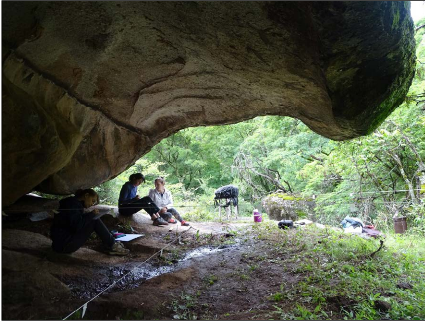
Figura 1. Vista general de la cámara principal de Oyola 34.