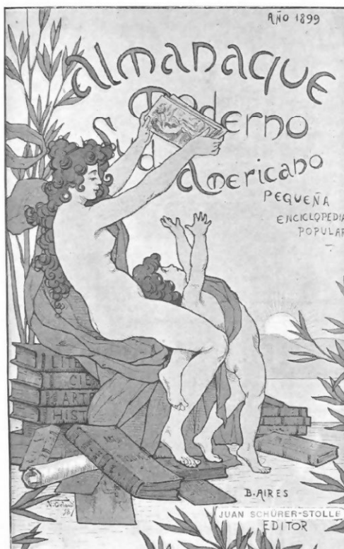
Imagen 1. Publicidad del Almanaque Moderno Sudamericano