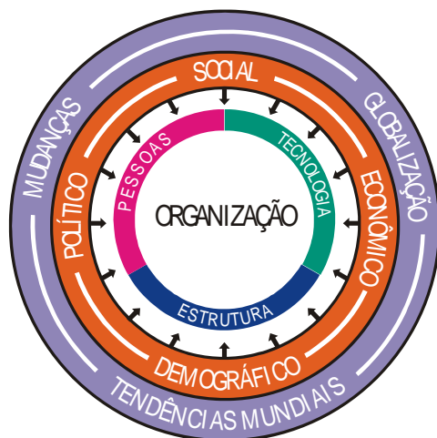
Figura. 3 – Forças Macro-Ambientais Que Geram Impacto Nos Elementos Essenciais da Organização

Estas mesmas forças atuam de forma implacável nas bibliotecas universitárias e influenciam seu equilíbrio e eficácia junto à clientela servida. A Figura 4 é uma transposição da Figura 3, ligeiramente modificada para retratar melhor a realidade das bibliotecas universitárias.