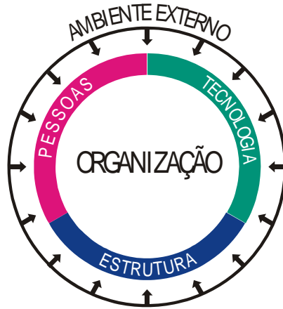
Figura 2 – Impacto do Macro-ambiente nas Organizações

É evidente que nenhuma organização opera em um vácuo. Ela está inserida em um macro-ambiente dinâmico e complexo. As características deste ambiente influenciarão os elementos essenciais que compõe a organização, como a Figura 2 ilustra.