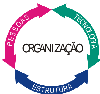
Figura 1 – Inter-dependência os Elementos Essenciais de uma Organização

Isoladamente, estes elementos – pessoas, tecnologia, e estrutura – não são suficientes para formar uma organização. Uma organização, portanto, é dependente destes três elementos. Os três são inter-dependentes e necessários para sua existência, conforme demonstrado através da Figura 1.