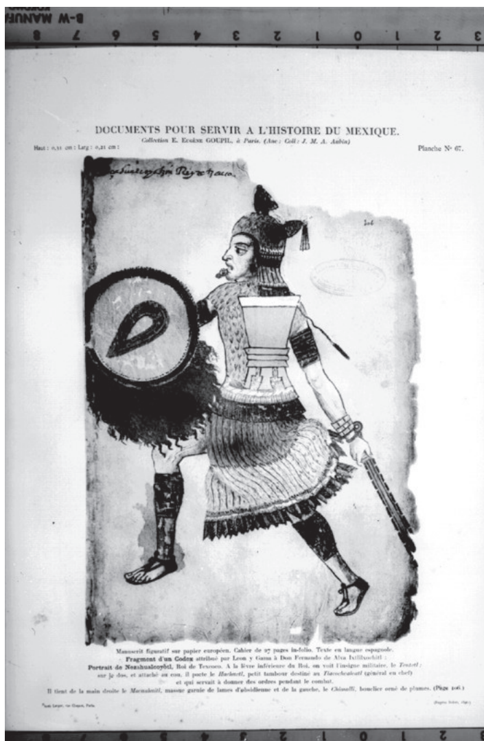
Figura 3. “Nezahualcōyotl como guerrero en el códice Ixtlilxóchitl”, Mediateca INAH. Disponible en Internet: https://mediateca.inah.gob.mx/islandora_74/islandora/object/fotografia%3A295586 Consultada el 10 de mayo de 2021.

como conceder de ambas tradiciones escriturarias: la acolhua prehispánica, codificada a través de los elementos que él contó para construir su discurso, y la de las fuentes cristianas occidentales, evidenciando la pertinencia de sostener sus afirmaciones a través del andamiaje cultural europeo con el que buscó redirigir la atención de sus posibles lectores hacia un centro político, Tetzcoco, que en su crónica resultó indispensable para sostener la hegemonía de Tenochtitlan hasta el momento de la guerra de conquista.