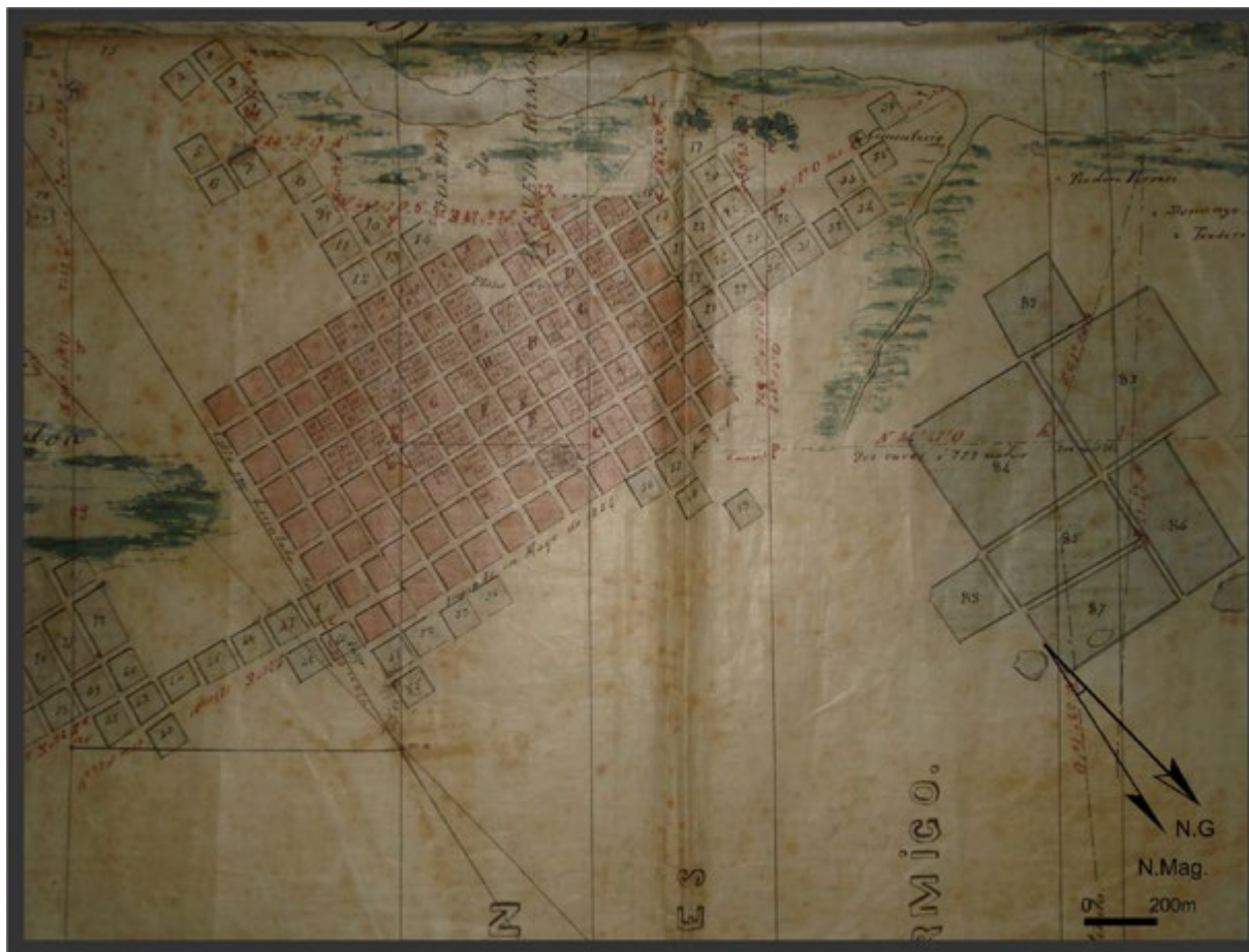
Figura 5. Detalle del plano del ejido de la Magdalena realizado por Pedro Benoit en 1860 (AHGyC, MOP, Exp. 34 de Magdalena).

La población del partido en el Censo nacional de 1869 cuantificó 7879 habitantes, de los cuales 1506 habitaban en el pueblo en 131 unidades censales. En el pueblo se registraron 87 casas de azotea, 13 de madera y 226 de barro y paja. Como puede notarse, era un pueblo pequeño y gran parte de la población residía en casas precarias. El plano, con una escala menor, no recogió las construcciones y sus ubicaciones en el pueblo.