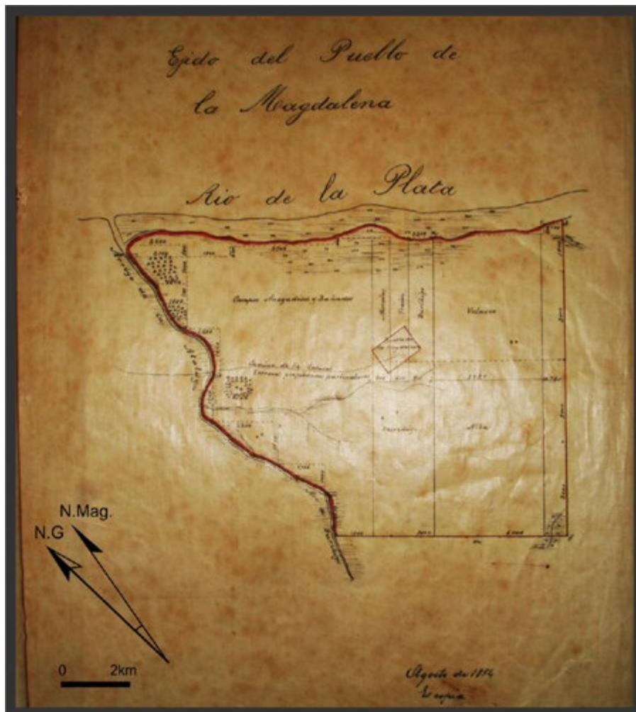
Figura 3. Propuesta de ejido del pueblo de la Magdalena, Arrufó 1854 (AHGyC, MOP, Exp. 12 de Magdalena).

los pueblos con su propuesta de traza y delimitar los límites de los ejidos (Canedo 2011). En el caso particular de estudio, en 1854 Jaime Arrufó, a cargo de la comisión Sur, realizó dos nuevos planos. En el primero, titulado "Plano del Ejido del pueblo de la Magdalena" 13 (Figura 3), el agrimensor delimitó el ejido, tomando los mismos accidentes naturales como límites aunque extendió su superficie hacia el sur de la cañada con respecto al plano de Saubidet. De esta manera, dos de sus lados resultaron irregulares por la presencia de cursos de agua, áreas de bañados y zonas anegadizas. En la mensura, aclaró que no podían seguir adelante por los inconvenientes de la topografía, por lo "fangoso del terreno y los espesos matorrales" 14 . Cabe señalar que si bien la ocupación ejidal era para la producción agrícola para el abasto, Arrufó señaló que este ejido estaba compuesto por tierras poco apropiadas para la labranza por ser anegadizas a lo que sumó la escasez de "brazos" para trabajarla. Indicó el camino a la capital y orientó el pueblo en relación al norte magnético.