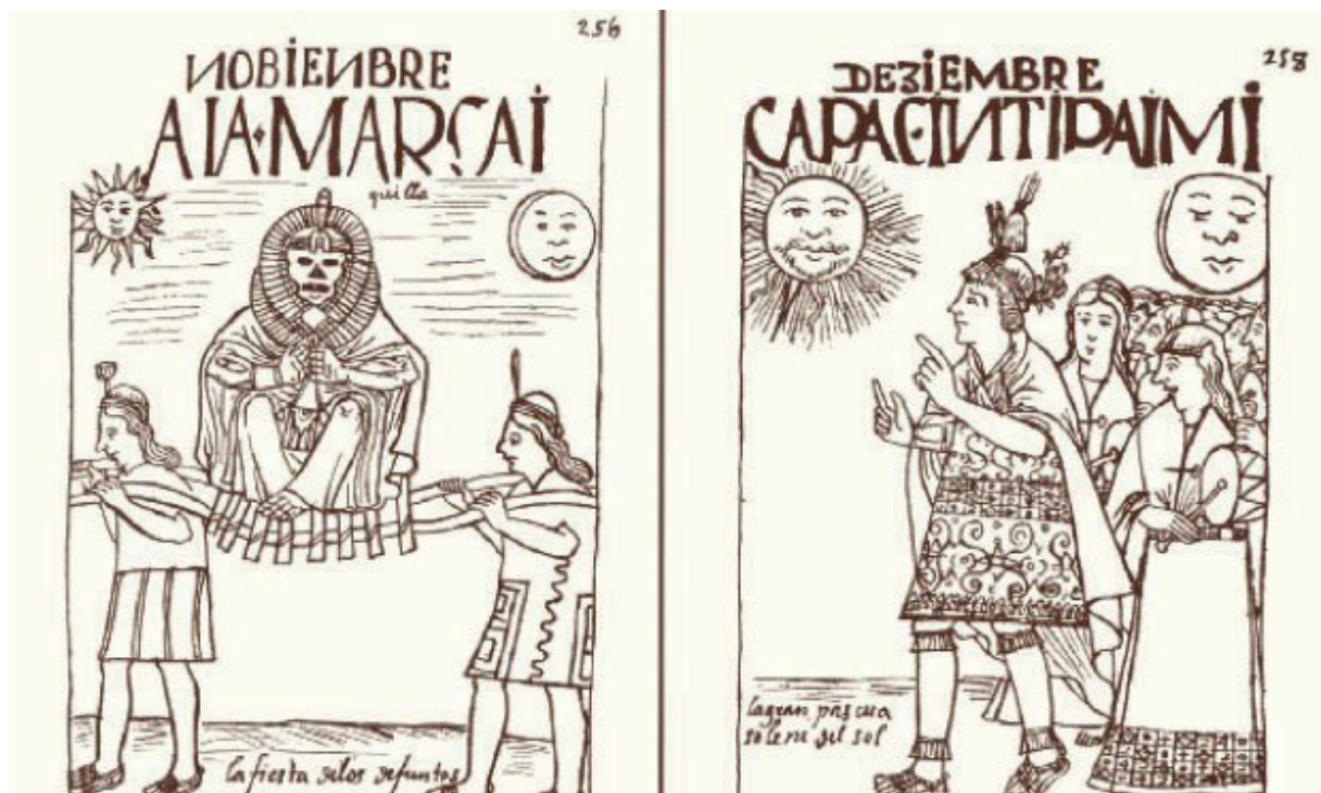
Figura 2. Uso de chipanas entre los emblemas de poder usados en festividades y celebraciones (Guaman Poma [1615] 1980: 258-260).

Brazaletes de oro y de plata se hallaron en los brazos de niños -varones- sacrificados en las capacochas en diversos lugares del Tawantinsuyu , entre ellos, en el cerro El Plomo y en el Lullailaco (Reinhard y Ceruti, 2010), éste último en Salta, o entre las miniaturas que acompañaban esos sacrificios. También, en sitios ceremoniales en el centro del imperio, en Choquepukio (Andrushko et al. , 2011) o en el Coricancha (Barreda Murillo, s/f ).