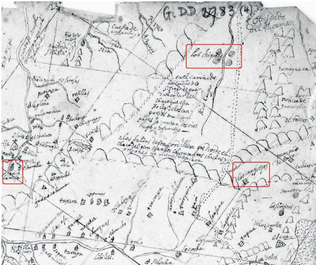
Figura 4. Sector del mapa anónimo de la Provincia de Charcas depositado en la Biblioteca Nacional de París, donde se señala a Los Chipanas. Se ha marcado también la ubicación de Tarija y Los Cangrejos.

(Fig. 1), muestran no sólo la fabricación menos esmerada de estas piezas sino, también, el uso de la aleación cobre-plomo (Tabla 1).