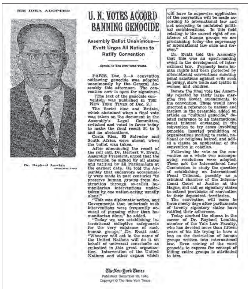
Figura 4. La ONU vota un acuerdo que prohíbe el genocidio. The New York Times , 10/12/1948.