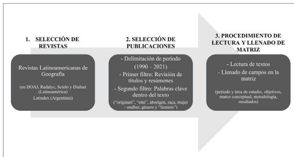
Figura 1. Pasos del proceso de trabajo.

Los textos enlistados en el procedimiento anterior fueron sistematizados en una matriz en la que cada fila de la tabla representaba un artículo y cada columna, un dato específico: autoría, año de publicación, título, revista, resumen, palabras clave, período estudiado, área de estudio, objetivos, marco teórico conceptual, metodología, resultados.