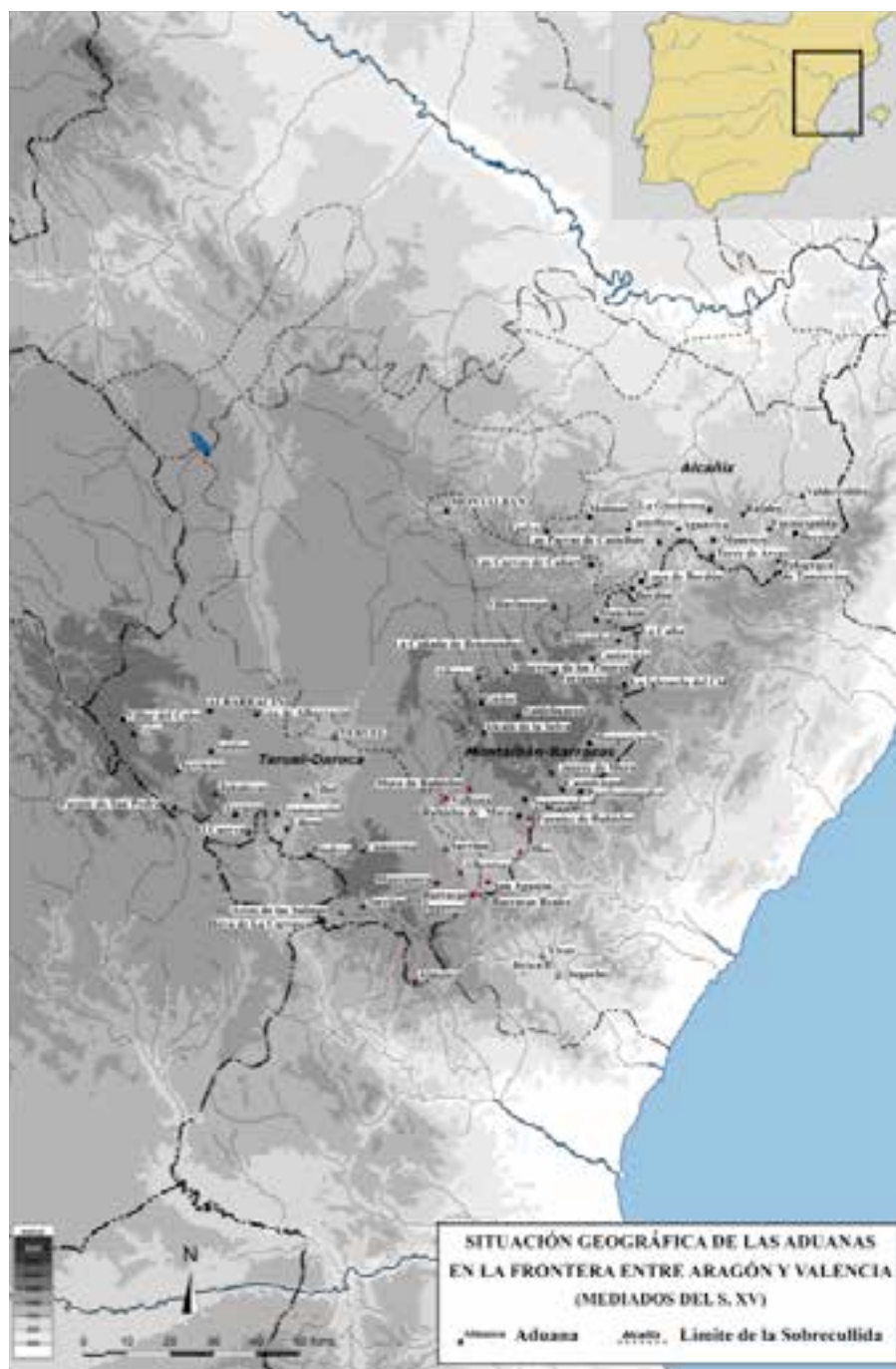
Fig. 2. Mapa con localización de las 'collidas' a mediados del siglo XV

43. La prueba del pago del tributo era el albarán de pago que del mismo expedía el guarda perceptor.