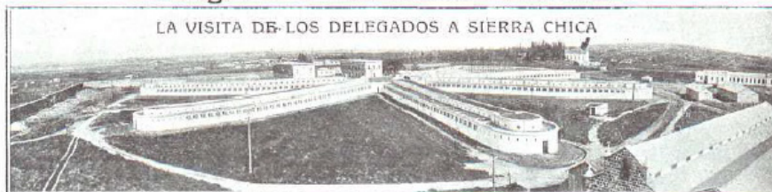
LA VISITA DE LOS DELEGADOS A SIERRA CHICA

Los miembros del Congreso Penitenciario Nacional han querido coronar sus tareas visitando un presidio. Y, afrontando molestias de viaje e inclemencias de tiempo, se han trasladado a Sierra Chica.