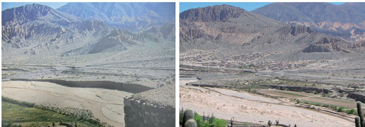
Figura 2. Vista del área de Sumay Pacha desde el Pucará de Tilcara previa a la conformación del barrio. A la izq. en 1982 (Chiozza y Figueira 1982: 20); a la der. en 2010.

de barro y piedras— por lo cual se trataría de un área de riesgo; y otros porque creen que estos actos atentan contra las políticas que promueve la Secretaría de Turismo y Cultura. La vecina Comisión Municipal de Maimará también criticó la toma pues, como apreciaremos en la entrevista a Héctor, alegaba que se trataba de una usurpación de las tierras de su jurisdicción.