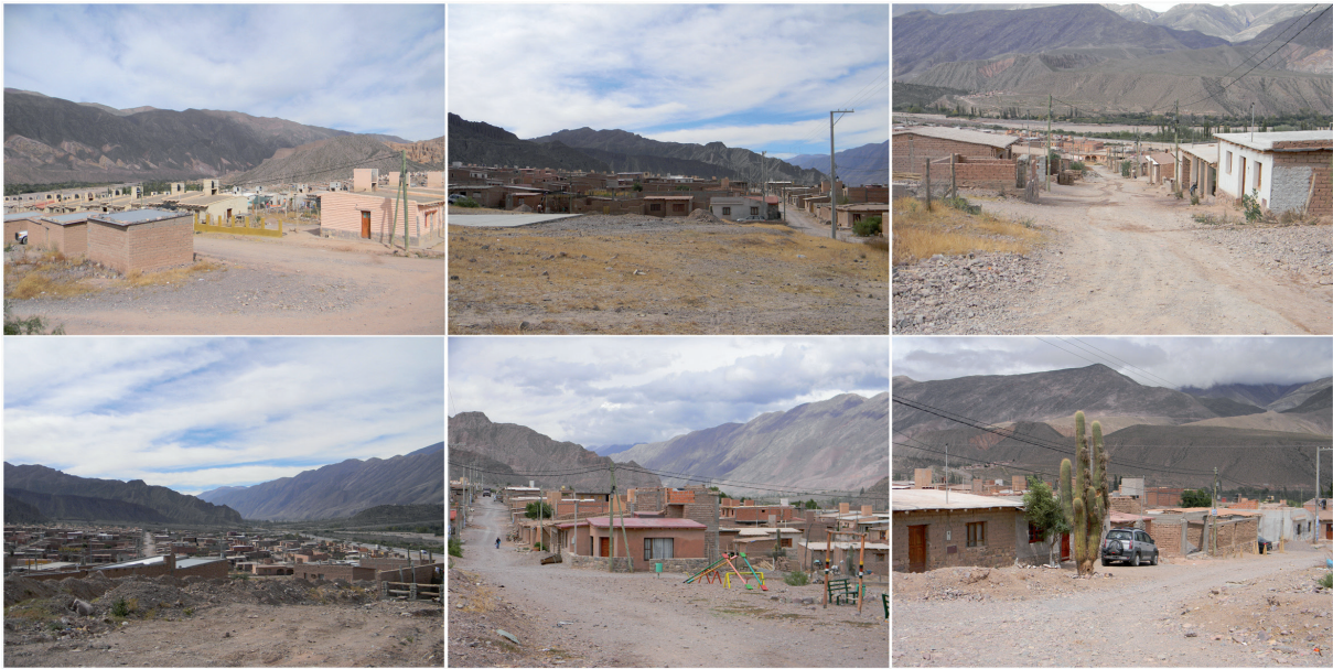
Figura 3. Barrio Sumay Pacha.