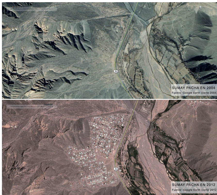
Figura 4. Sumay Pacha en 2004 (a) y en 2012 (b).

(7) [respecto del posible crecimiento de Sumay Pacha] Yo creo que este plano ya dio el corte, las limitaciones que corresponde, porque hay zonas que son de altísimo riesgo pero veo que al no haber un diálogo con Maimará, Maimará a veces asienta la gente y después cuando se asienta lo da... Entonces viene acá la gente, tenemos que llamar a mensura, incluirlos si es posible y sino desligar responsabilidades (S).