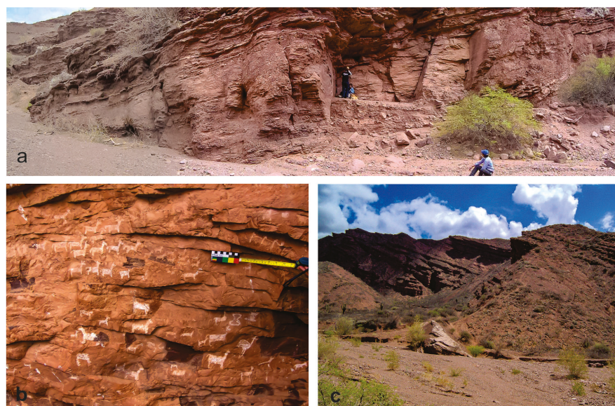
Figura 4. Las Figuritas: a) vista general de los paneles; b) Panel Central, se destacan los camélidos semianálíticos; c) vista del arroyo tributario donde se encuentran emplazados los paneles con arte.