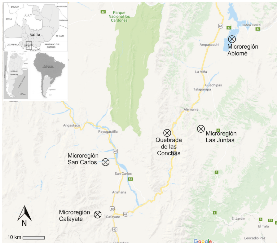
Figura 1. Ubicación de la Reserva de la Quebrada de las Conchas en relación con las microrregiones San Carlos, Cafayate, Las Juntas y Ablomé.