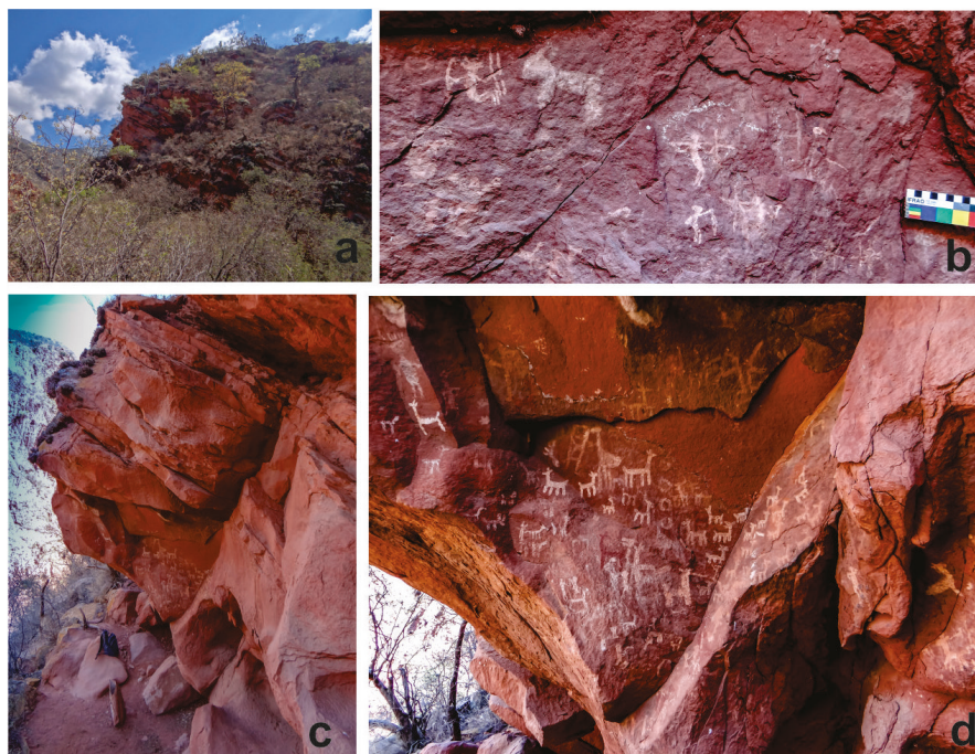
Figura 6. Alemania. a) vista general del panel desde la quebrada; b) detalle del panel inferior con las figuras humanas de perfil y extremidades flexionadas y felino; c) vista del panel izquierdo y detalle del mismo; d) detalle de c).