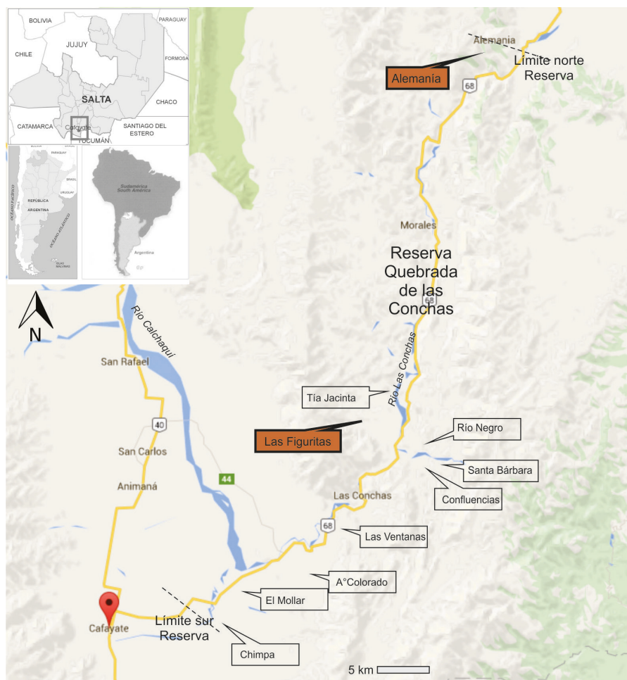
Figura 2. Ubicación de los sitios arqueológicos relevados en la Reserva Quebrada de las Conchas. En color marrón se destacan los sitios con arte rupestre.

Para realizar las comparaciones de diseños –como evidencia de intercambio de información– fueron analizadas las representaciones rupestres de los sitios Alemania y Las Figuritas y se definieron cánones y patrones específicos para la quebrada de las Conchas (Ledesma, 2009, 2015). 2 Posteriormente, se cotejaron los mismos con la información disponible en el sur del valle Calchaquí y en el valle de Lerma. Para ello se consideraron los antecedentes e investigaciones sobre arte realizados en las microrregiones Cafayate, San Carlos, Las Juntas y Ablomé que están ubicadas en la provincia de Salta (Figura 1) (Podestá et al. , 2005, 2013, 2016; de Hoyos, 2012; Ledesma y Subelza, 2014; Falchi, 2016).