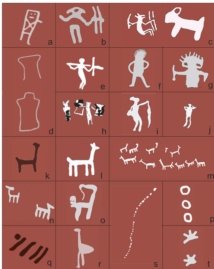
Figura 5. Sitio Alemaña. a) figura humana de cuerpo rectangular; b) figura humana con objetos portantes; c) figura humana de perfil y extremidades flexionadas junto a un felino; d) escutiforme incompleto; e) figura humana con objetos portantes; f) figura humana simple con tocado; g) figura humana simple con tocado y objeto portante; h) figuras humanas con uncu y objetos portantes; i) figura humana de perfil y extremidades flexionadas; j) figura humana simple; k) camélido semiesquemático con cuerpo lineal de dos patas; l) camélidos semiesquemáticos, con cuerpo lineal de cuatro patas; m) camélidos semiesquemáticos en caravana de cuatro patas; n) camélidos semiesquemáticos con cuerpo lineal de cuatro y tres patas; o) simio; p) círculos; q) líneas paralelas; r) suri; s) puntos alineados; t) estrellas. Figura 6. Alemaña. a) vista general del panel desde la quebrada; b) detalle del panel inferior con las figuras humanas de perfil y extremidades flexionadas y felino; c) vista del panel izquierdo y detalle del mismo; d) detalle de c).

Se han registrado los siguientes motivos rupestres: camélidos, figuras humanas, aves (suri), felinos, simio, motivos geométricos y abstractos. Respecto al canon de camélidos, se destaca la representación semiesquemática, con el cuerpo angosto o lineal, con cuatro, tres y dos patas. Las figuras humanas se encuentran aisladas o en escena y se definieron los siguientes patrones de dichas figuras: de perfil y extremidades flexionadas, simple y con tocado, de cuerpo rectangular, con uncu y otras con tocados y armas. Las tonalidades son blanco, rojo y negro. El tamaño de los motivos es pequeño y no superan los 10 cm de altura en promedio. El total de motivos registrados es de 124 (Figuras 5 y 6).