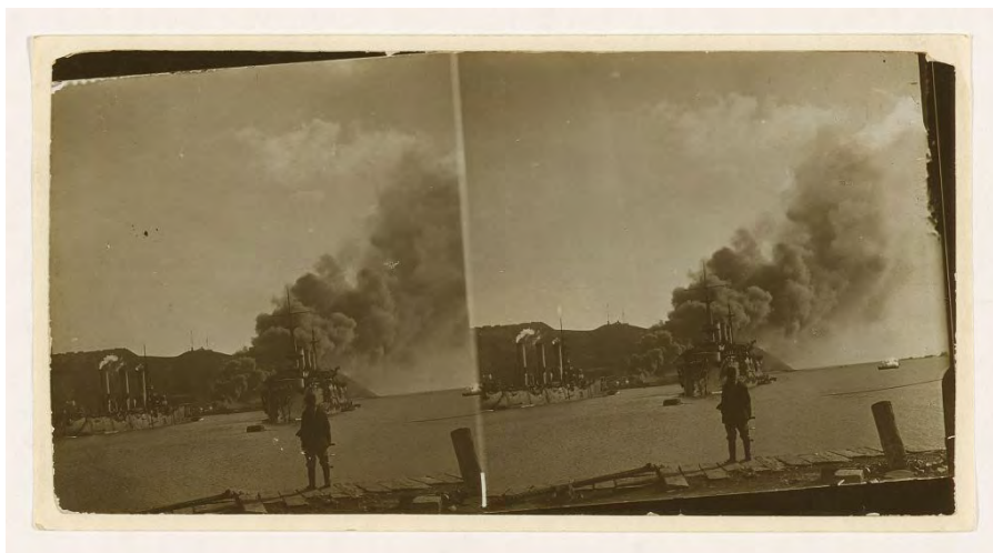
In Port Arthur, during the bombardment. Raging fire near Golden Hill started by Japanese shell (1904)

Por su parte, las características de esta contienda propiciaron una singular relación entre los hechos y el modo en el que eran narrados visualmente. Si bien no hay duda de que las imágenes tomadas tuvieron como destino la sociedad de las dos naciones implicadas, también es cierto que tuvieron un importante ámbito de actuación en Europa y Estados Unidos. A pesar de haber sido librada en los confines del mundo oriental, la guerra despertó un gran interés entre las potencias a ambos lados del Atlántico y las casas editoriales no dudaron en buscar el modo de satisfacer dicha demanda. Las técnicas de impresión que se habían ensayado en los enfrentamientos anteriores van a ser puestas a prueba de nuevo. Así, formatos como las fotografías estereoscópicas lograron hacer las delicias de los ciudadanos europeos y estadounidenses al transportarlos al lejano frente de batalla con esa singular capacidad inmersiva que solo esta técnica posee, al proporcionar su característica tridimensionalidad. 16