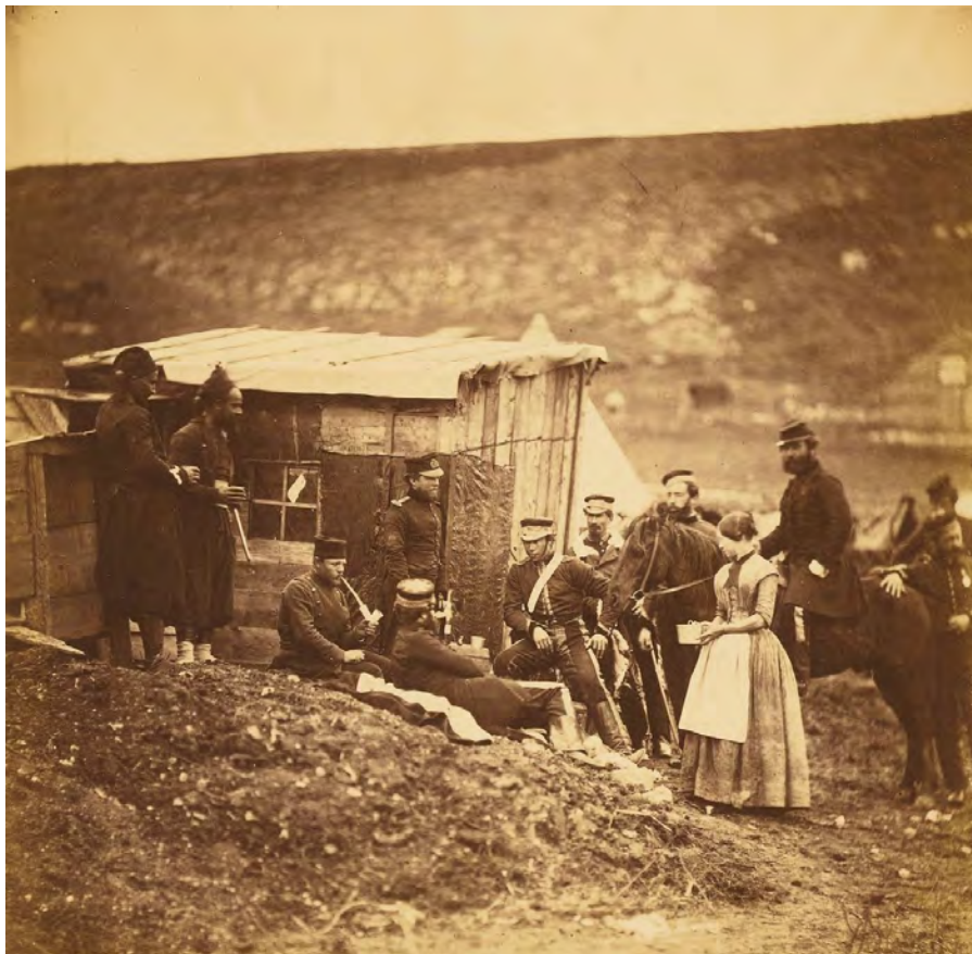
Camp of the 4th Dragoons, convivial party, French & English (1855)