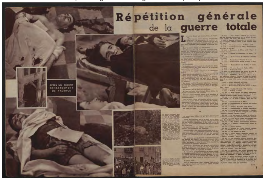
Répétition générale de la guerre totale (1937)