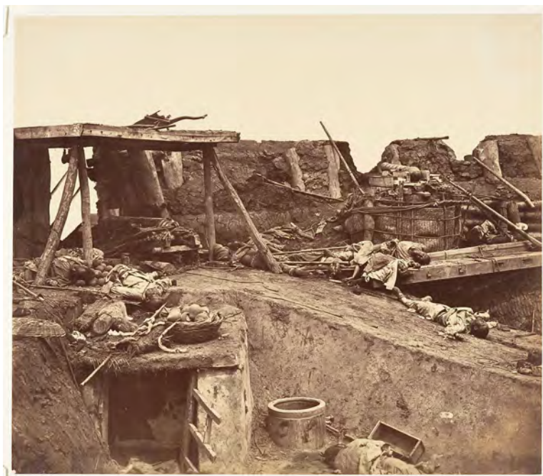
After the Capture of the Taku Forts (1860)