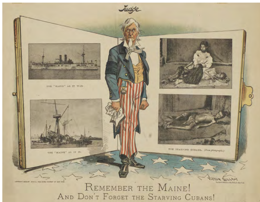
Remember the Maine! And Don't Forget the Starving Cubans! (1898)