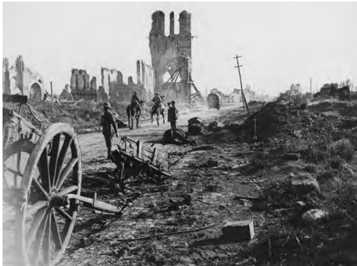
Cloth Hall at Ypres (ca. 1916)