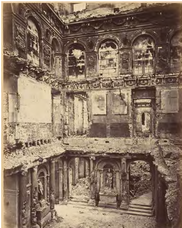
Palais des Tuileries incendié. Intérieur de la Salle des Maréchaux (1871)

el que quedó la ciudad de París y sus alrededores. 14 Las fotografías, tomadas por Alphonse J. Liébert, conforman un extraordinario catálogo visual y elevan el dolor propio de la guerra, por primera vez, a un plano diferente al físico. En este caso, el daño emocional por la pérdida de elementos patrimoniales se posiciona como un elemento que no puede pasar desapercibido y que debe ser utilizado en la transmisión de los hechos a la sociedad.