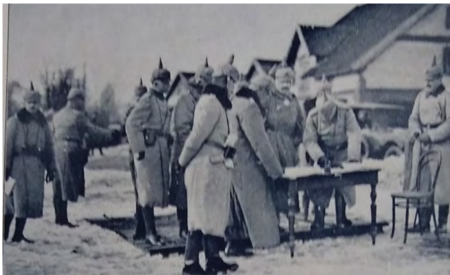
El emperador junto con sus oficiales en Polonia. Germania, 27 de enero de 1916

Desde esta mirada, uno de los beneficios de la guerra fue fomentar en los campamentos militares los valores democráticos entre camaradas al disolver los privilegios de clase. Se subrayó nuevamente la voluntad del pueblo para tomar partido en la gesta heroica de la conflagración. Este concepto se extendió hasta la figura del emperador Guillermo II, cuya persona encarnaba la función de padre de los soldados y sintetizaba todos los atributos del Imperio. Ante la celebración de su natalicio, la revista editó un número especial en el cual el emperador, idolatrado por sus tropas, demostraba sus destrezas como gran capitán del ejército y se lo reconocía como un líder cercano a cada uno de sus soldados en el frente de batalla, siendo visto hasta en "las primeras trincheras" ("El emperador y el ejército", 27 de enero de 1916, Germania ). Las afirmaciones sobre la presencia del Kaiser en el campo de batalla fueron reforzadas con fotografías (Imagen 8).