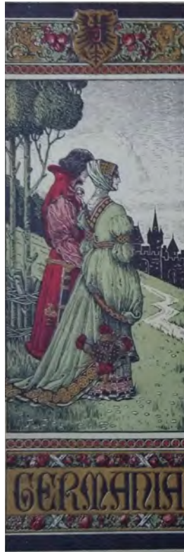
Ilustración sobre el triunfo de Arminio (Hermann) en la batalla de Teutoburgo. Germania , 16 de junio de 1915

imágenes que recuperaban esos hechos históricos e hicieron eco de la superioridad militar germana como uno de los rasgos esenciales de su “raza”, en especial aquellos que reflejaron triunfos alemanes sobre Francia. 7