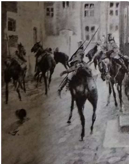
Soldados sorprendidos en su descanso. Alemania, 1 de septiembre de 1915

Resulta de sumo interés la manera en la que se retrató la vida de los soldados alemanes en los campamentos y en el frente de batalla, así como las autoridades militares y su relación con sus subordinados. El esfuerzo por demostrar el reverso del discurso del autoritarismo alemán propugnado por los aliados condujo a reconstruir al campamento como un espacio idealizado, en el que se ponía en práctica el progreso del hombre en materia armamentística