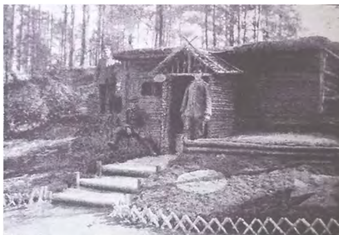
Fotografía de una morada de oficiales. Germania , 16 de abril de 1916

Los supuestos cuidados que recibían los soldados germanos en el frente de batalla por parte de sus jefes eran asimilados al amor de un padre a su hijo, cuestión que atenuó los discursos de la rígida disciplina alemana. Los vínculos entre los combatientes se mostraron conformados por lazos afectivos más que jerárquicos. Las fotografías de los “chalets” exhibieron únicamente las moradas de oficiales y las trincheras de los soldados se presentaron a través de ilustraciones (Imágenes 9 y 10), punto que podría sugerir ciertas sospechas.