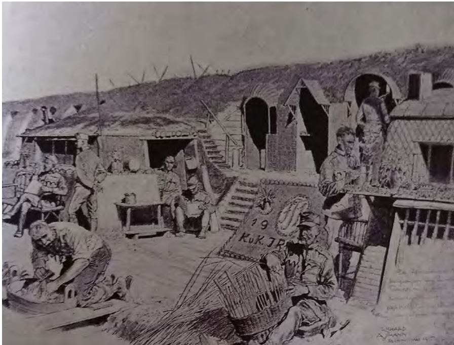
Ilustración de las trincheras. Alemania, 16 de abril de 1916

En la imagen 10 se pueden observar soldados realizando diferentes tareas que poco tenían que ver con la extrema situación en la que se hallaron; por ejemplo, aparecían leyendo, lavando la ropa, confeccionando un canasto; todo en un clima muy armonioso. No obstante, se lograron vislumbrar ciertas tensiones sobre la presunta horizontalidad y camaradería que se mostraba entre los soldados y sus superiores en los campamentos. Las noticias propias, en ocasiones, también justificaron las diferencias existentes entre los soldados y los altos mandos militares: