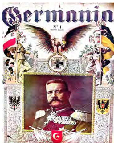
Portada del primer número de la revista con la fotografía de Hindenburg. Germania , 1 de junio de 1915

los respectivos uniformes de los imperios alemán y austro-húngaro y, en el centro, la cruz de hierro sobre la cual reposaba el águila imperial (Imagen 2).