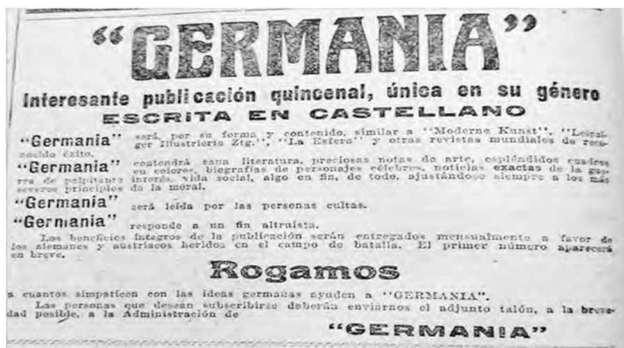
Anuncio de la revista en los diarios de la comunidad. La Unión , 11 de mayo de 1915

El editorial del primer número reprodujo el mismo mensaje que los anuncios promocionales y demostró cierto desconcierto en cuanto al grado de aceptación por parte del público. Se alertó sobre “la imagen distorsionada” que el mundo recibía de Alemania como consecuencia del control ejercido por los aliados en la divulgación de las noticias de la guerra; es por eso que su propuesta apuntaba a “exponer con sincera fidelidad gráfica y literariamente, los episodios de la actual lucha en sus diferentes manifestaciones”, lo que señalaba la importancia que se le otorgaba a la imagen como un recurso probatorio de los acontecimientos ( Germania , 1 de junio de 1915). La divulgación de textos de intelectuales locales y extranjeros y la exposición de fotografías e ilustraciones alusivas a los escenarios de batalla resultaron las principales estrategias utilizadas para posicionar a la revista como una observadora imparcial de los acontecimientos. 5 Los artículos fueron titulados de manera descriptiva; por ejemplo: “La guerra”, “La industria del acero”, “La vida en los campamentos”, entre otros. Aquellos en los que se tomaba posición sobre la conflagración, y no eran escritos por personalidades conocidas, fueron firmados con seudónimos, lo cual daba cuenta del temor de quedar expuestos ante la opinión pública.