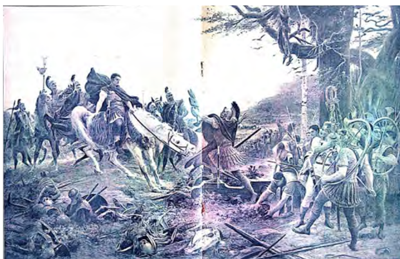
Portada del número 22. Germania , 16 de abril de 1916

Esta modificación en los diseños de las portadas evidencia un cambio en la estrategia de publicación, posiblemente ligado al estancamiento de ambos bandos en el campo de batalla y al hecho de que la guerra de trincheras generó cierta mesura en los ánimos triunfalistas del comienzo de la guerra.