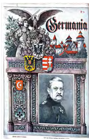
Cambio en el diseño de portada a partir del cuarto número. Germania , 16 de julio de 1915

A partir del número 4 se modificó el diseño de tapa, reduciendo el tamaño de la fotografía y colocándola más cerca del margen derecho, lo mismo sucedió con el símbolo de la cruz de hierro que apareció en el margen inferior izquierdo. Sobre la imagen del general se ilustró a un soldado medieval con su armadura, empuñando su espada y escudo, arriba del cual reposaba el águila. Por debajo, se ubicaron los emblemas de los Imperios, siempre el de Alemania más elevado que el resto y el Otomano por debajo de los otros y en menor tamaño. En el fondo se podía observar un castillo, que podría asimilarse al de los Hohenzollern, cuna de la familia de los reyes de Prusia y emperadores de Alemania (Imagen 3).