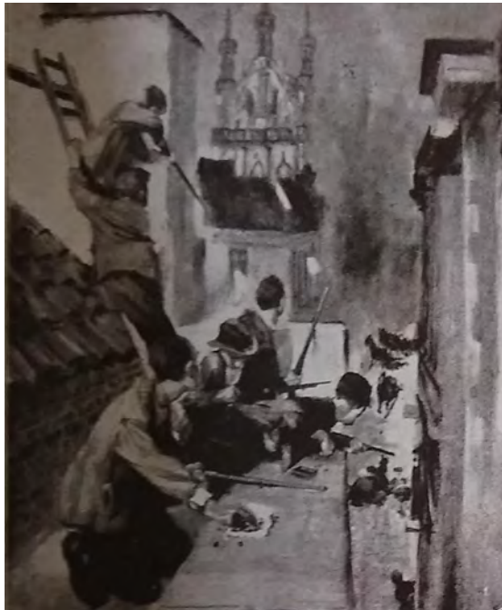
Civiles belgas atacando a soldados alemanes. Alemania, 1 de septiembre de 1915