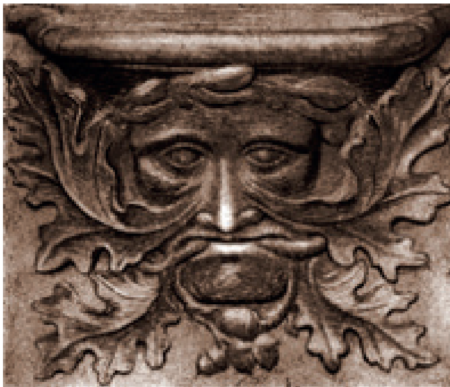
Figura 4. Green Man, etching - Medieval misericord. Abbey-church of Vendôme, France, s. XI.

Esta imagen está representada con un lenguaje “animalizado”, perteneciente al llamado grotesco. 7 Entre otros símbolos desarrollados en el grotesco está el del Hombre verde , (figura 4) el cual durante la Edad Media fue licenciado, incluso alentado, por los constructores de iglesias. La cabeza que lo representa expulsa por la boca un follaje de hojas y frutos propio del árbol del roble, árbol sagrado de los druidas y de otras creencias paganas (Gary, 2006); por otro lado, el color rojo de su rostro y su lengua son atributos demoníacos que remiten al fuego infernal. Todos estos elementos cumplen la función de generar un distanciamiento del carácter angélico, condición original del diablo. 8