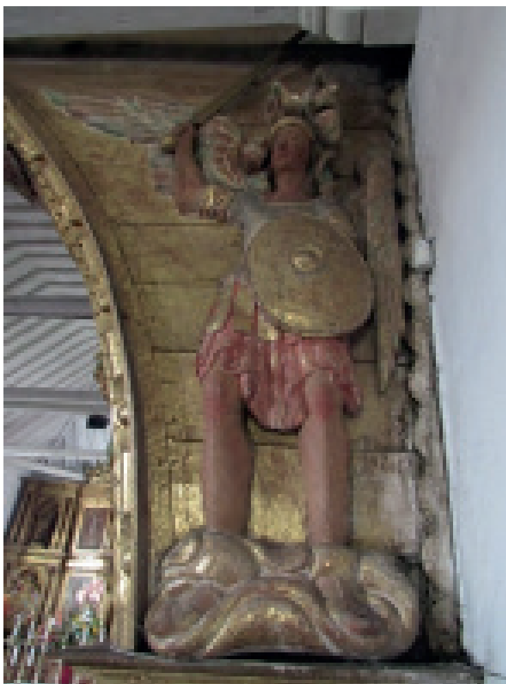
Figura 8. Arcángel san Miguel, frente del arco toral, lateral derecho superior (2017).