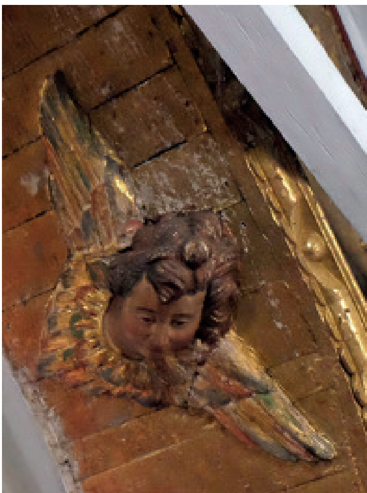
Figura 6. Uno de los dos querubines ubicado a los lados del Diablo, arco toral, capilla doctrinera de Tópaga.

El diablo, ubicado en la parte interior superior del arco toral, en su caída va acompañado o custodiado, en ambos lados, por dos querubines. Estos tienen rostros aniñados, son morenos y con cabellos enredados, y durante su vuelo, miran hacia al frente y despliegan sus alas. 20 (Figura 6).