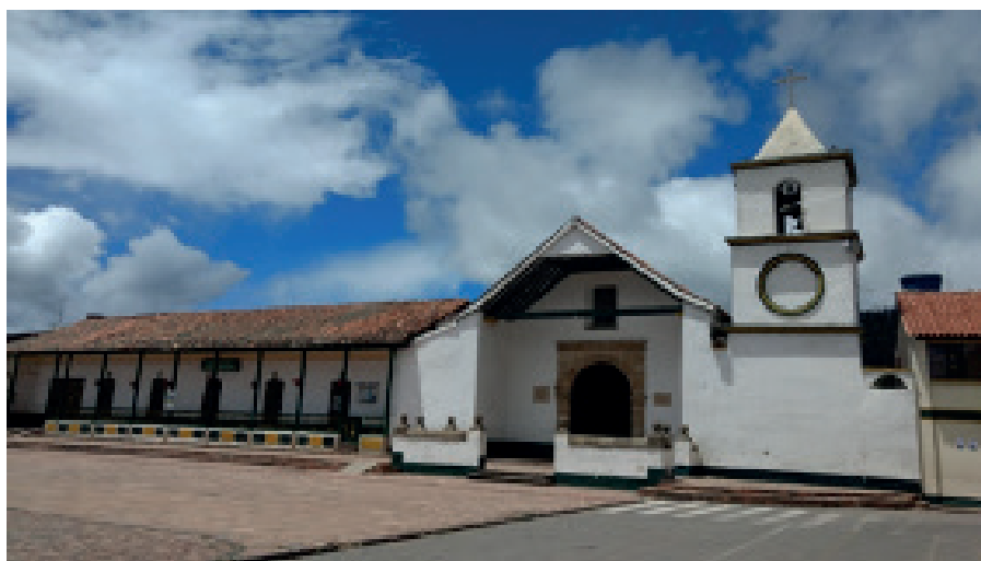
Figura 1. Capilla doctrinera Inmaculada Concepción Tópaga, Departamento de Boyacá, Colombia.

(...) en sus diversas modalidades icónicas, fueron objeto de especial atención por la orden que construyó (...) un gran proyecto estético a través de sus intelectuales quienes desde las últimas décadas del siglo XVI y a lo largo del XVII configuraron una teoría de la imagen sagrada y de las maneras de transmitirla para estimular la Devotio moderna y extendida. 1