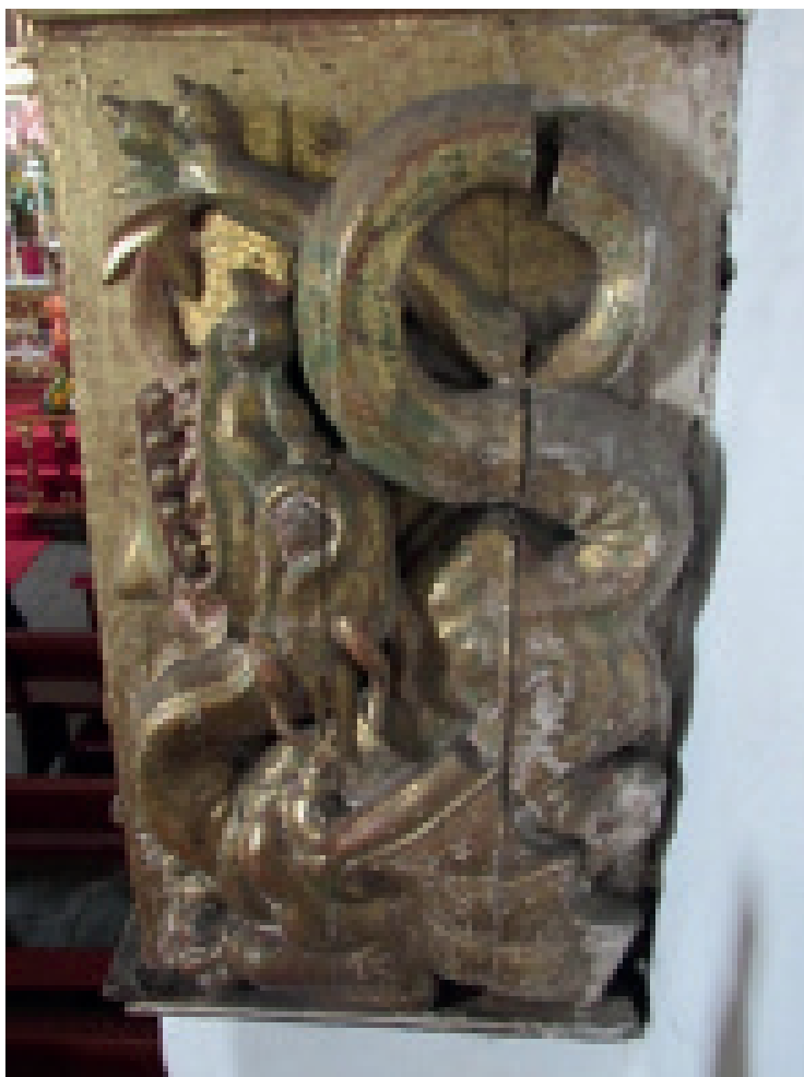
Figura 9. Dragón, frente del arco toral, lateral derecho inferior.

Por último, la escena del arco toral se completa con las figuras que aparecen en los dos lados inferiores de la sección interior: dos ángeles del silencio (figura 10). Cada figura está de pie y su rostro se dirige hacia los feligreses. Llevan el cabello largo ondulado hasta los hombros y una diadema que corona su cabeza con un moño. Visten una túnica con un cinto de tela que termina en un gran nudo amarrado a la cintura, desde donde caen largos lazos. El índice de la mano, en un caso la derecha y en el otro la izquierda, está sobre los labios. En el otro brazo, cada figura carga un gran cuerno de la abundancia (cornucopia), casi de la altura del ángel, en cuyo interior se observan papayas, manzanas, guayabas y vides.