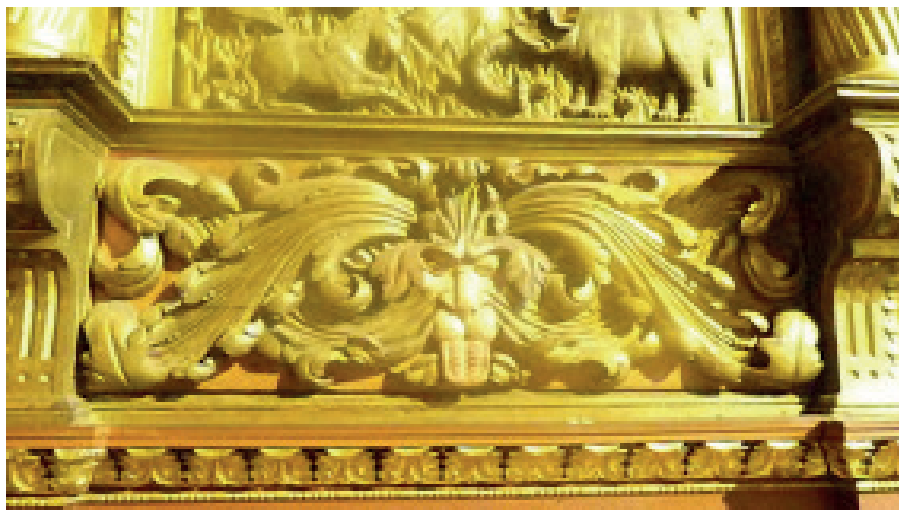
Figura 5. Mascarón en el banco del retablo mayor de la iglesia de san Francisco, Bogotá.