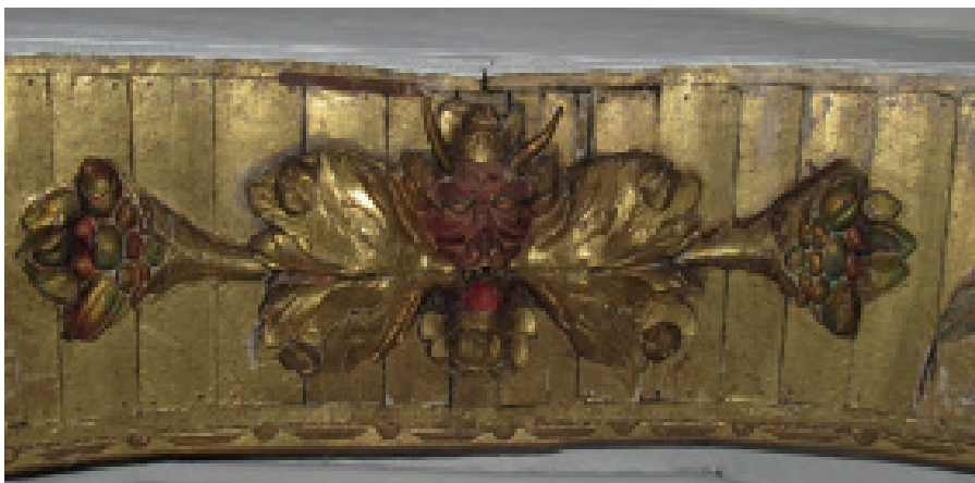
Figura 2. El Diablo de Tópaga, hojas y bellotas del árbol del roble salen de su boca, arco toral capilla doctrinera de Tópaga.