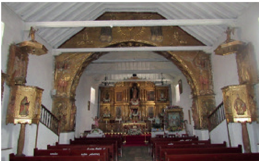
Figura 3. Interior capilla de Tópaga: en primer plano los dos púlpitos, luego el arco toral y como fondo escenográfico del arco, el retablo mayor.