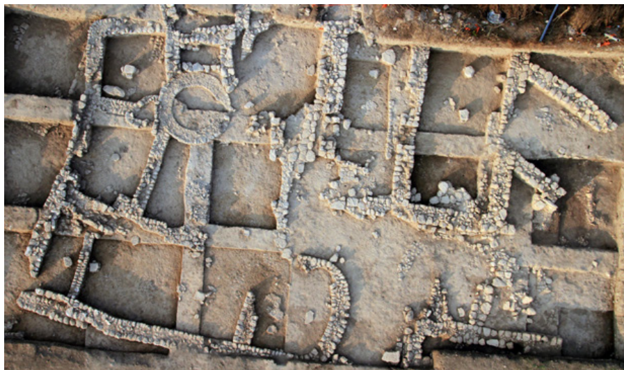
Fig. 3. Ein Zippori, edificios del Área B, vista aérea.