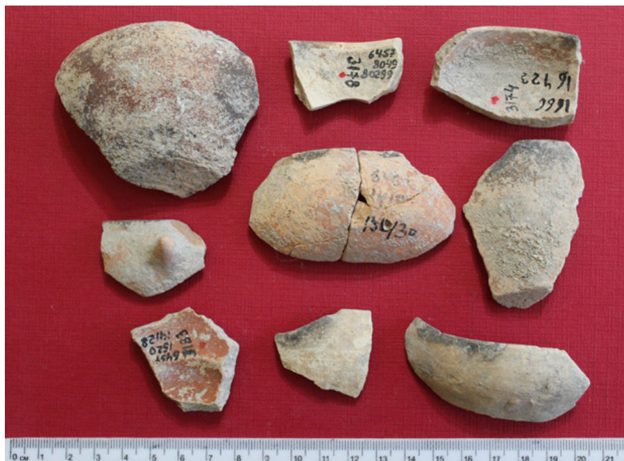
Fig. 5. Foto de diferentes lámparas de aceite de Ein Zippori.

Se recogió todo el suelo excavado durante la excavación, tamizando 21.523 tiestos de vasijas cerámicas del período Bronce Antiguo IB, 303 de ellos pertenecientes a lámparas de aceite (Figs. 5, 6). Hay que tener en cuenta que en los aproximadamente mil bordes de cuencos del período Calcolítico temprano encontrados en el sitio, no se identificó ninguno con marcas de quemaduras u hollín.