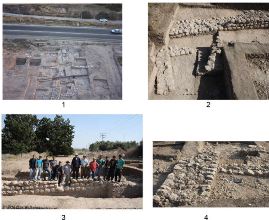
Fig. 4. Ein Zippori, fortificación de las áreas D3 y N5. 1) Vista general hacia el norte (cortesía Ala Yaroshevich, IAA). 2) Casa cerca de la fortificación en el Area D3, vista hacia el este (foto Nimrod Getzov, IAA). 3) Enno Brun, supervisor de área, y los obreros sobre la fortificación en el Area D3, vista hacia el este (foto Nimrod Getzov, IAA). 4) Vista hacia el nordeste de la torre adjunta a la fortificación en el Area N5 (cortesía de Ala Yarosevich, IAA).

Entre las vasijas de alfarería encontradas en este estrato, se destacaron tipos comunes en los conjuntos cerámicos de la cuenca del mar de Galilea, tales como: cuencos con revestimiento agrietado ( Crackled Ware , Esse, 1989) y fosas con borde engrosado cortado en círculo con decoración de cono. Gran parte de los recipientes de almacenamiento están decorados con la decoración de bandas llamada Grain Wash Ware (Amiran, 1969: foto 42; Braun, 1985: Fig. 19:10-1). También se encontraron dos improntas de sellos con patrones geométricos típicos del Bronce Antiguo II, pero sobre cerámica típica del Bronce Antiguo IB (Paz et al. , 2018).