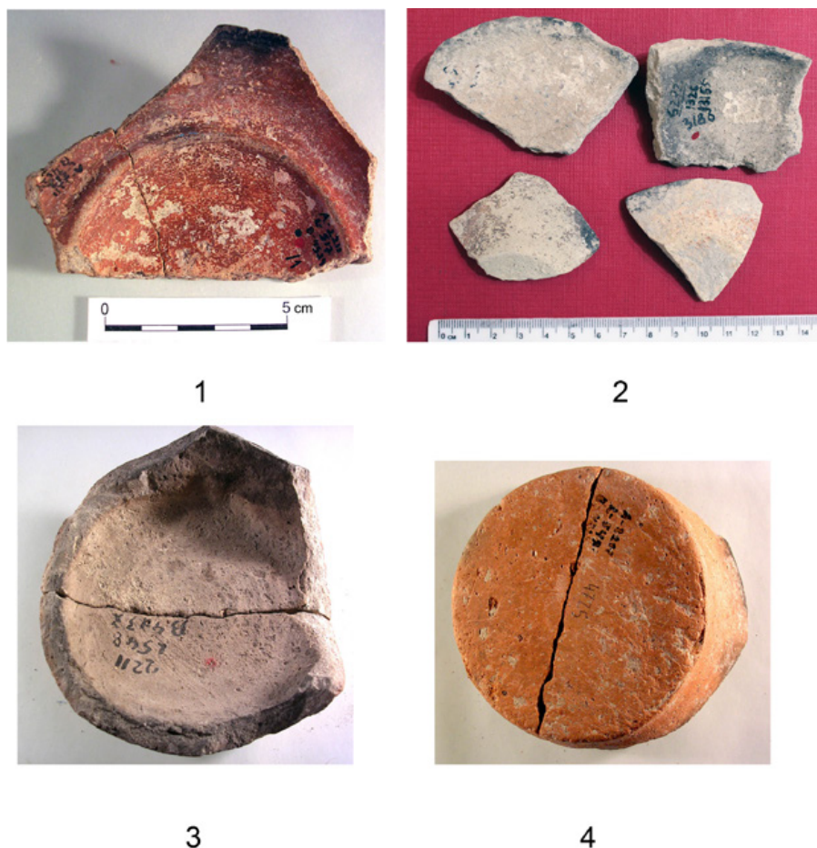
Fig. 7. Bases de diferentes lámparas de aceite de Ein Zippori.

se encontraron lámparas de este tipo en la excavación actual en la que sobrevivió un perfil completo, desde el borde hasta la base, pero en una excavación previa realizada por Barzilai en el sitio, se encontró uno de esos elementos (Fig.6: 17, Barzilai et al. , 2014: Fig. 9: 7).