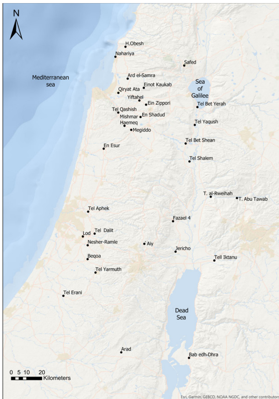
Fig. 1. Mapa con la ubicación de los sitios mencionados en el texto (producción Atalya Fadida, basado en el programa ESRI).