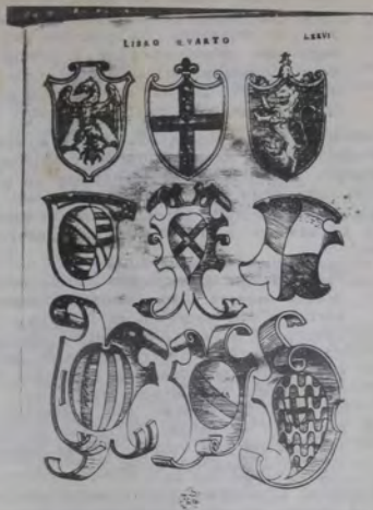
Figura 5. Escudos.

liza allí una terminología claramente hermética.