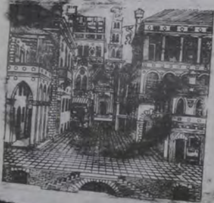
Figura 1. Escena cómica.

Segnatura y las figuras de la Justicia divina y de las Ciencias pintadas en la bóveda de esa misma Stanza; reunió entonces el marco arquitectónico de la Escuela de Atenas y el paisaje de la Disputa y del Parnaso, realizando un todo armónico y autónomo, sin personajes, que representaba la naturaleza y el mundo del hombre bajo la influencia de los poderes fatales del cielo. Esta perspectiva, tan semejante a una escenografía, asumía el carácter de andamiaje matemático-simbólico del Universo, de emblema visual en el recorrido diurno de los astros. No se puede asegurar con certeza que Peruzzi haya transmitido a su amigo Serlio algunos elementos de este saber