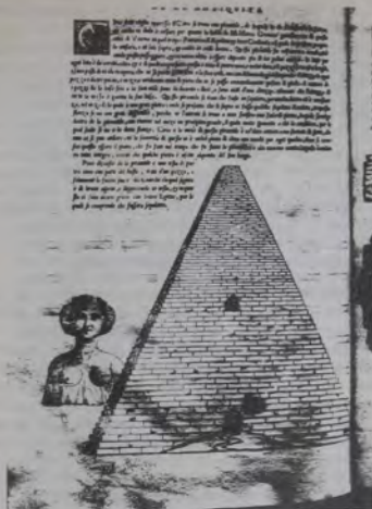
Figura 2. La pirámide y la esfinge.

otro de la Esfinge y un párrafo explicativo, sobre la base de los datos aportados por Marco Grimani, patricio veneciano que había viajado a Egipto y medido personalmente aquel sepulcro colosal (60).