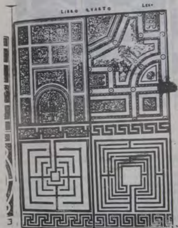
Figura 3. Laberintos.

Mas no es eso todo en cuanto al eco del hermetismo en el tratado serliano. Siempre en el Libro IV, se encuentran detalles emparentados con nociones alquímicas. Los dos proyectos de jardines en forma de dédalo nos remiten a las ideas herméticas del mundo laberíntico (86). En los dibujos de los "cielos planos" de madera, que reproducen