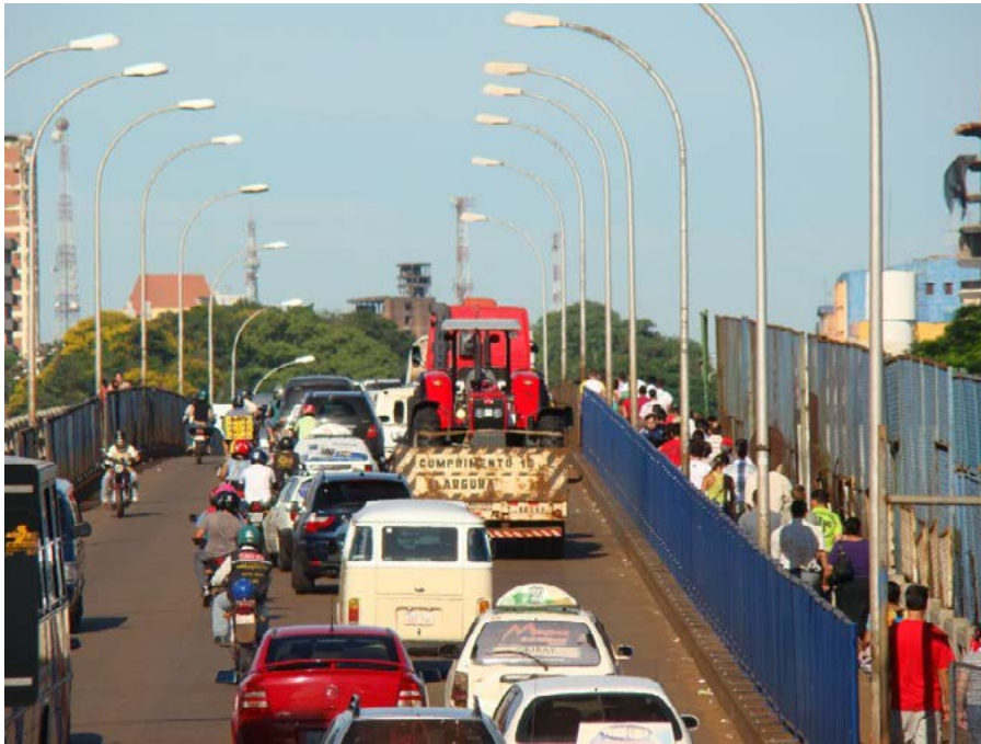
Figura 2. Tráfego pesado na Ponte da Amizade, sentido Paraguai. Fonte: Daniel M. Huertas (04.jan.2010)

e a aplicação de multas por excesso de peso tem sido recorrente. A questão que envolve a obrigatoriedade ou não de cabine-dormitório no tráfego internacional também tem acarretado conflitos