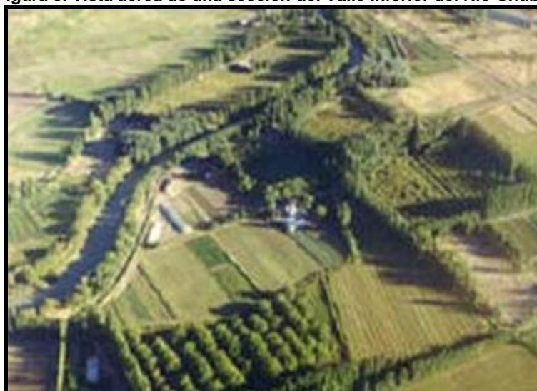
Figura 3. Vista aérea de una sección del Valle Inferior del Río Chubut