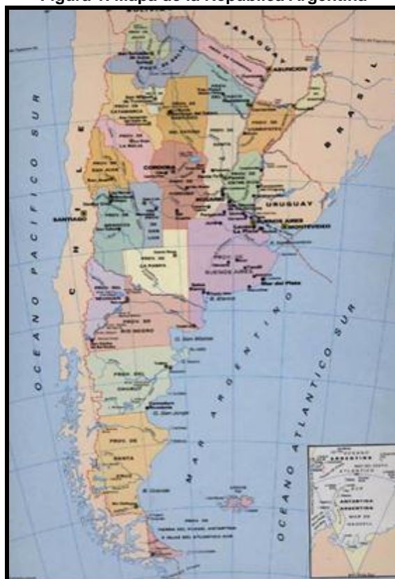
Figura 1. Mapa de la República Argentina