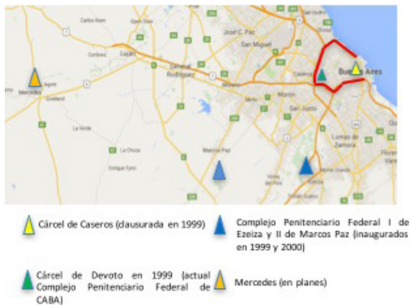
Figura 3. Mapa de las ubicaciones de los principales establecimientos penitenciarios federales. Fuente: elaboración propia en base a Google Maps.

En el año 1995, el Ministerio de Justicia Nacional lanza el Plan Director de la Política Penitenciaria Nacional , proponiendo, entre otros temas, un nuevo diseño geográfico de las unidades penitenciarias federales. El plan abogaba por la clausura de las dos principales cárceles federales que aún quedaban en la Ciudad de Buenos Aires: las unidades de varones de Caseros y Devoto. Y proponía el desplazamiento de las personas detenidas en estas unidades hacia la periferia del conurbano bonaerense, mediante la construcción de nuevos complejos penitenciarios más grandes y con mayor espacio. El plan contemplaba la construcción de un complejo penitenciario en Ezeiza, dos en Marcos Paz y al menos siete nuevos complejos en otros lugares del país y la Provincia de Buenos Aires. Todos ellos debían estar terminados a fines de 1999. Los nuevos edificios prometían proveer de una adecuación más moderna, acorde a los paradigmas de los objetivos de resocialización de los detenidos, y contribuir con la reducción de la sobrepoblación que presentaban los obsoletos edificios de las unidades vigentes a mediados de los '90.