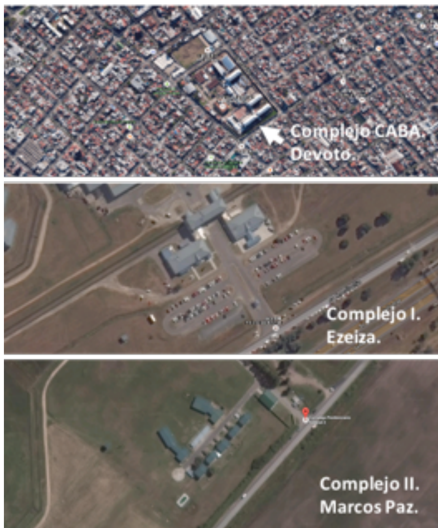
Figura 4. Vista panorámica de las entradas del Complejo I de Devoto, II de Ezeiza y III de Marcos Paz.

van a visitar. Todos los jueves, uno de los días con mayor concurrencia al penal, se organizan cursos de cocina en el horario en el que la mayoría de las mujeres esperan para entrar a la visita. En Devoto, el hecho de que la cárcel esté dentro de la ciudad implica que la espera se realiza fuera del perímetro de la cárcel.