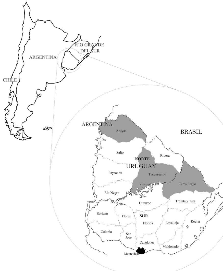
Figura 1. Mapa del Uruguay y la región considerada en la discusión. En gris y negro, los departamentos con estudios genéticos; el Río Negro delimita las regiones norte y sur, excluido Montevideo, marcado en negro.

Los departamentos en los cuales se reportaron mayores porcentajes de ascendencia principal indígena fueron Tacuarembó (5,7%), seguido por Salto (4,9%), ambos en el norte del país. Es de notar la escasa diferencia entre los valores máximos y los mínimos; estos últimos determinados en Colonia (1,1%), Lavalleja y Florida (1,4%), todos en el sur del país (INE, 2011) (Figura 1).