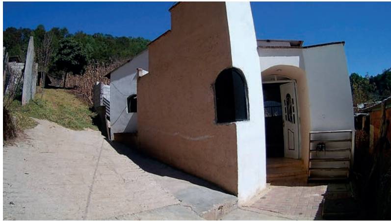
Figura 4. Mezquita Al Kauwsar