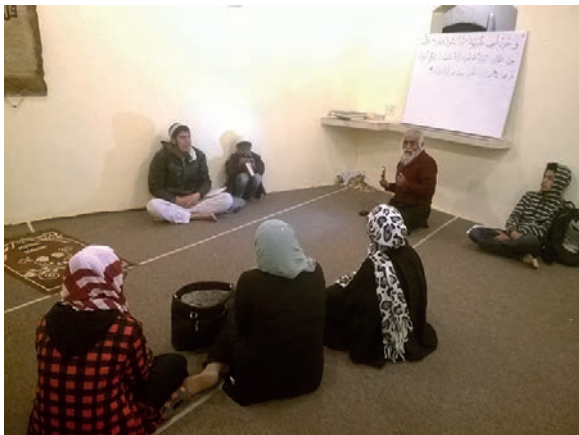
Figura 5 y Figura 6. Reuniones en la mezquita Al Kauwsar Miembros de la mezquita Al Kauwsar