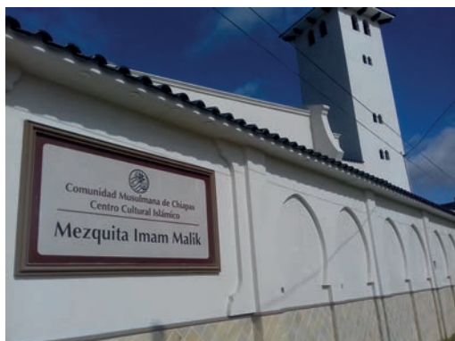
Figura 2. Mezquita Imam Malik