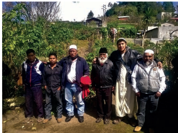
Pie de figura 5 y 6:

La realización de estos cursos estaba acompañada de un conjunto de ceremonias ligadas al calendario religioso islámico, tales como el ramadán, el Eid al-fitr (celebración del fin del ramadán) y el Eid al-Adha (fiesta del sacrificio). En estas se desarrollaba una lógica intercomunitaria que propició el reforzamiento de los lazos de afinidad entre los conversos, al fortalecer los ámbitos del parentesco y la familia y estimular la creación de lealtades primordiales y afectivas. Aspectos que eran sancionados por los murabitun , como por ejemplo, los hábitos culinarios, fueron reincorporados nuevamente en las festividades y celebraciones tzotziles-musulmanes (figura 7).