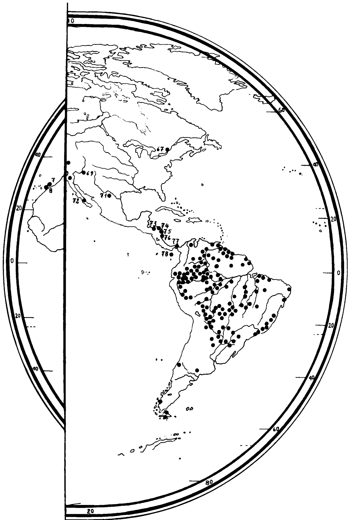
i. - 58, Warramunga. - 59, Unmatjera. - 60, Arunta. Caledonia. - 63, I. San Cristóbal. - 64, I. Malaita (bridas). - 66, I. Fidji. - 67, Ontario. - 68, Klamath. - 69, California Central. - 71, Laguncros. - 72, Calif. del Paya. - 73, Sumo. - 74, Mosquito. - 75, Cuna. - 76, Mosquito. - 77, Cuna. - 78, Mosquito.