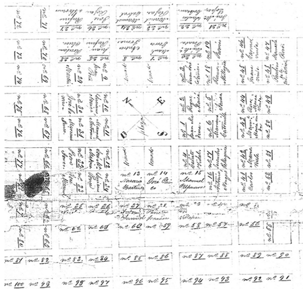
Figura 2. Plano original de Villa Fidelidad, 1856 (Museo y Archivo Histórico “Enrique Squirru” de Azul).

De este modo se originó Villa Fidelidad, que hoy constituye un barrio de la ciudad de Azul, cuyos habitantes, en buena parte, se reconocen actualmente como descendientes de las tribus pampas originarias (Lanteri, Pedrotta y Ratto, 2008; Lanteri et al. , 2011). Los acuerdos de 1856 fueron la base para restablecer vínculos relativamente pacíficos entre el gobierno y los “indios amigos”, quienes se reinstalaron en los sectores rurales de Azul, Tapalqué y Olavarría, y poblaron el asentamiento urbano