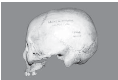
Figura 1: Cráneo masculino braqui-platicránico en norma lateral –orientación Frankfurt– de la población giliak (Siberia). Es uno de los tipos craneanos más adaptados a las bajas temperaturas por su relación neurofacial única. Su nivel de adaptación al frío glacial es aún mayor que la de los amerindios.

Estas características son propias de los aborígenes americanos en general y se heredan de las poblaciones asiáticas en las que se han desarrollado por mecanismos selectivos, cuya expresión extrema puede encontrarse –entre otros– en el cráneo giliak (Figura 1) que resume en su llamativa globularidad neurocraneana todos los atributos de esta forma de defensa ambiental. Este tipo craneano tan particular fue compartido por otras poblaciones sometidas al mismo ambiente climático que sufrieron los giliaks, que a su vez, están emparentados con grupos ainu. Ellos son también denominados nivkh (que significa persona), y suman actualmente unos 1.200 habitantes, que están geográficamente circunscriptos a la región de Amur y a la isla Sajalín, en el extremo oriental de Asia.