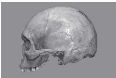
Figura 2: Cráneo dolico-platicránico, visto en norma lateral –orientación Frankfurt– del sur de Australia. Es un masculino de gran tamaño y forma angosta y alargada, que conserva todas las características que son también propias del cráneo paleoamericano.

lugar a un hiperdesarrollo de los estudios craneológicos, que muchas veces son la herramienta fundamental con que se cuenta para distinguir un cráneo de tipo amerindio de otro que no lo es, tal como el de los australianos, tasmanianos y otros pobladores de los mares del Pacífico no adaptados al frío, pues ellos no han sufrido la transformación mongoloidizante propia de las zonas bajo influencia de la última glaciación (Figura 2).