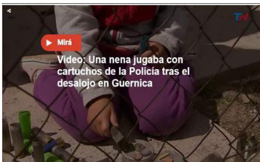
Imagen 4. Clarín , octubre 30 7 .

cuatro años de una casa vecina que fue encontrada jugando con “cartuchos de la Policía tras el desalojo” que entraron en su jardín. El comentario en el subtítulo, que ella es “fanática de Peppa Pig ”, crea una yuxtaposición, enfatizando la pérdida de la inocencia de la niña producida por el incidente. Esto se refuerza en el discurso multimodal que acompaña al artículo, un video que empieza enfocándose en las manos de la niña, que juegan con los cartuchos en vez de con juguetes, acompañado por un texto blanco repitiendo el mismo mensaje. El efecto semiótico de Impacto aquí es el de “causa y efecto” destacado en la tabla 1, apuntando que esta niña ha perdido su inocencia como consecuencia de las tomas de tierras en Guernica: