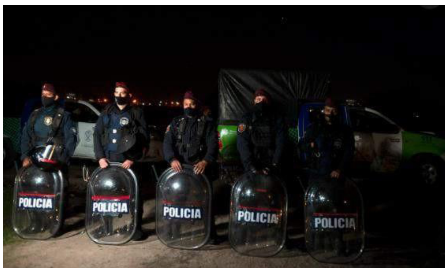
Imagen 5. Clarín , octubre 30e.

Este video aboga por la respuesta de seguridad armada de 4.000 miembros del personal de seguridad como el enfoque más eficaz para recuperar el terreno en Guernica. Esto es reforzado por Clarín con la "fotogalería" de 22 fotografías tomadas un día después del desalojo (octubre 30e). Aquí, por ejemplo, una fila de cinco miembros de las fuerzas de seguridad, con sus caras cubiertas y miradas fijas a la distancia en la oscuridad de la noche, domina. Sus uniformes, armas, escudos y vehículos, que aluden al ambiente tenso del conflicto, completan la construcción del Impacto en la imagen (5):