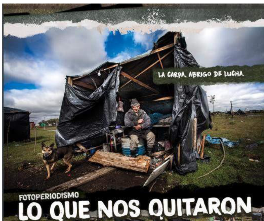
Imagen 8. La Garganta Poderosa (101, 35).