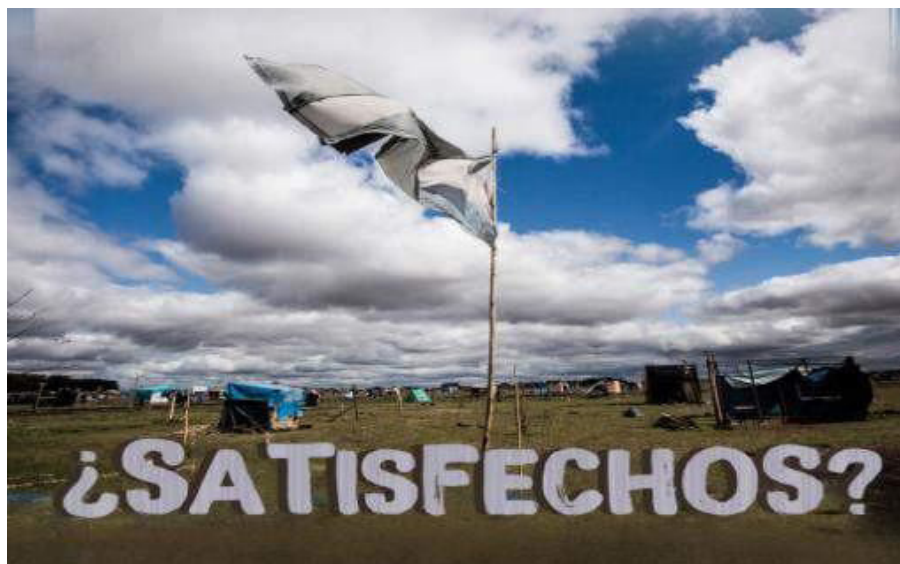
Imagen 7. La Garganta Poderosa (101, 4).

argentina rasgada ondeando en un palo está en primer plano, con los restos del asentamiento de Guernica al fondo, ambos rodeados por un cielo azul con nubes blancas que reflejan los colores de la bandera. La leyenda dice “¿Satisfechos?” (7). Esto refuerza las cuestiones planteadas en el editorial que socavan las justificaciones del gobierno para el desalojo, descrito como un “circo de prepotencia” (17):