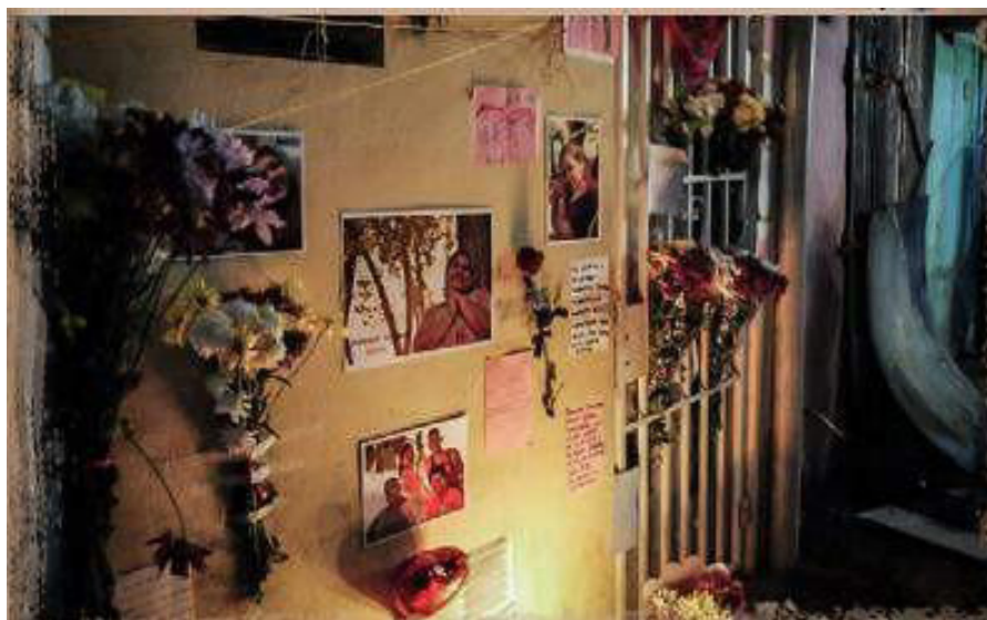
Imagen 3. La Garganta Poderosa (96, 5).

Los vínculos de solidaridad entre Ramona y su comunidad se refuerzan en las imágenes que aparecen en esta edición (96), particularmente en aquellas donde vemos su casa cubierta de cuadros, flores y notas escritas a mano después de su fallecimiento (imagen 3). Esta imagen refuerza con elementos semióticos de símbolos culturales familiares (tabla 1) el valor noticioso de Proximidad creado en el texto que la acompaña.