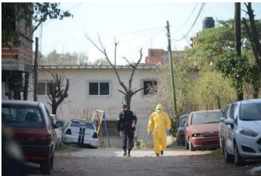
Imagen 1. Clarín , mayo 29.

Un discurso del desastre también está presente en las fotografías que acompañan a estos artículos. Las calles de un barrio popular en Ensenada se muestran vacías con una imagen (1) que se centra en un policía y un profesional médico con un traje hasmat caminando entre filas de autos. En cuanto a los recursos semióticos señalados en la tabla 1, esta imagen representa una imagen negativa de secuelas.