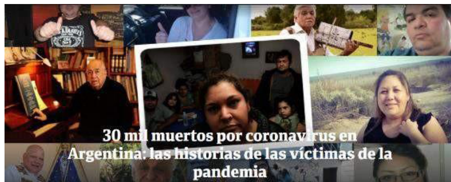
Imagen 2. Clarín, octubre 29.

una conmemoración de la dictadura de 1976-1983, durante la cual ONGs estiman que se alcanzó el mismo número de desaparecidos. Aquí, se puede leer nuevamente una crítica al gobierno peronista, contrario a la dictadura y liderado por Alberto Fernández, y a sus medidas durante la pandemia, destacadas como inadecuadas para detener la propagación de la enfermedad, particularmente entre los pobres.