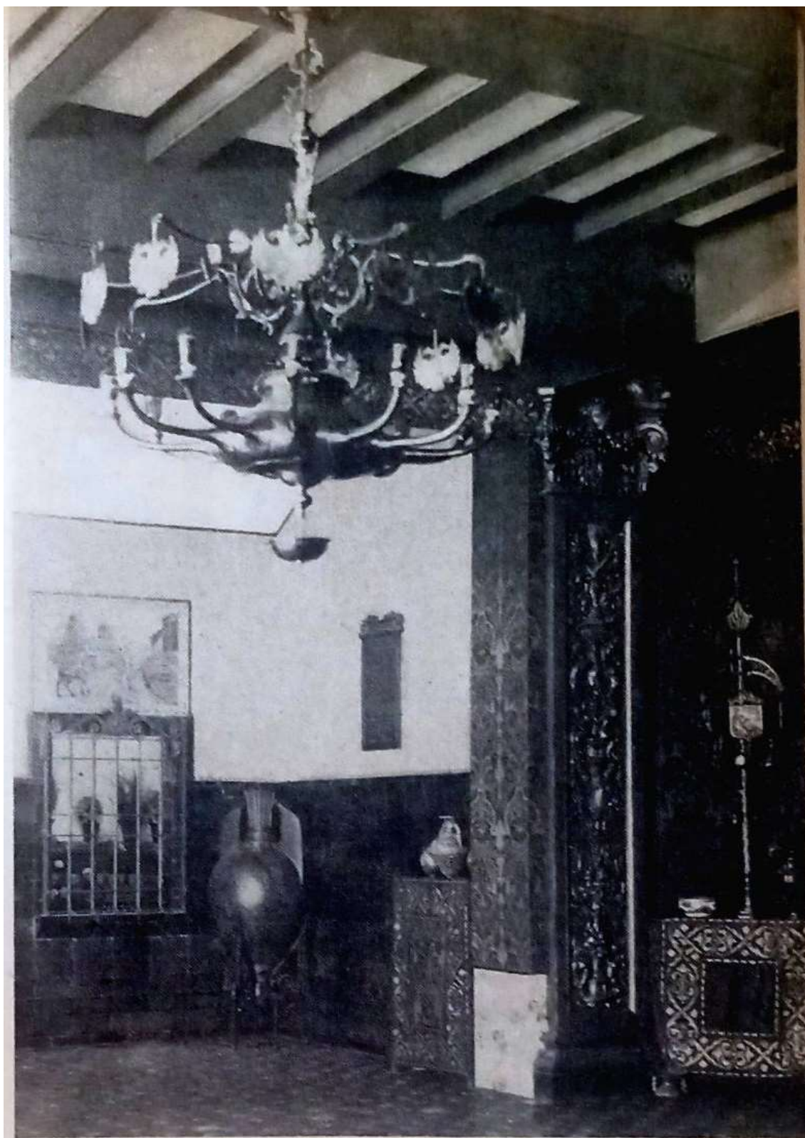
Un detalle decorativo del Teatro Nacional de Comedia

Guía Quincenal de la actividad intelectual y artística argentina , año 1, n° 1, segunda quincena, abril 1947