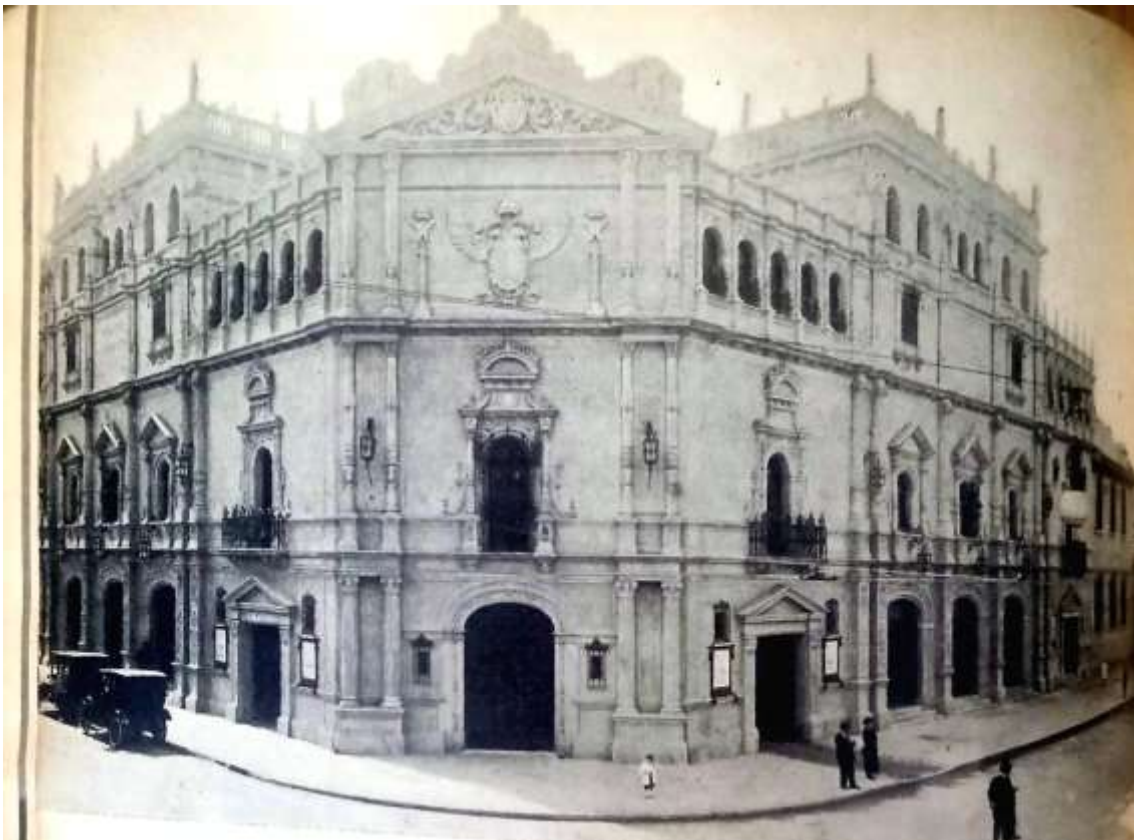
Teatro Nacional de Comedia

Guía Quincenal de la actividad intelectual y artística argentina , año 1, n° 1, segunda quincena, abril 1947