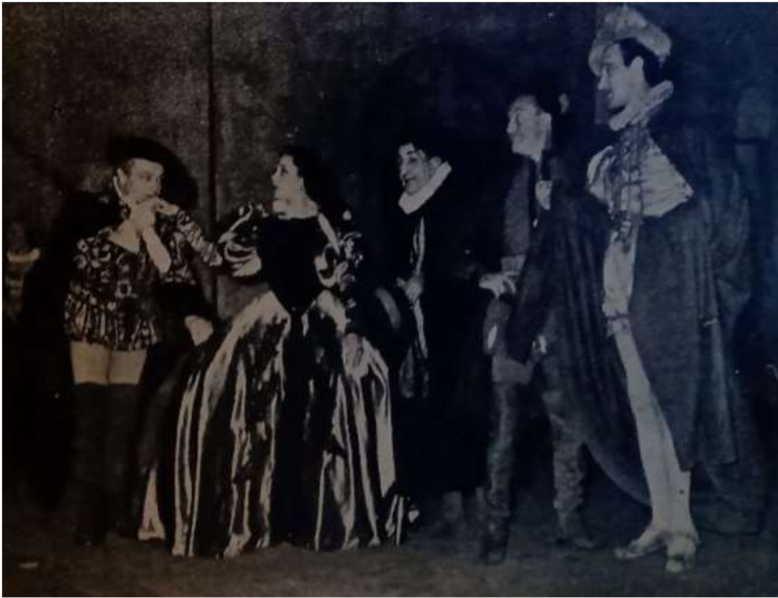
Escena de La fiorecilla Domada

Guía Quincenal de la actividad intelectual y artística argentina , n° 74-75, primera y segunda quincena, noviembre de 1950.