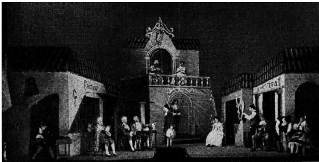
Puesta en escena de Don Gil de las calzas verdes , de Tirso de Molina (1948), con dirección de Ponferrada.

Boletín de Estudios de Teatro , año VI, tomo VI, n° 22-23, julio-diciembre 1948