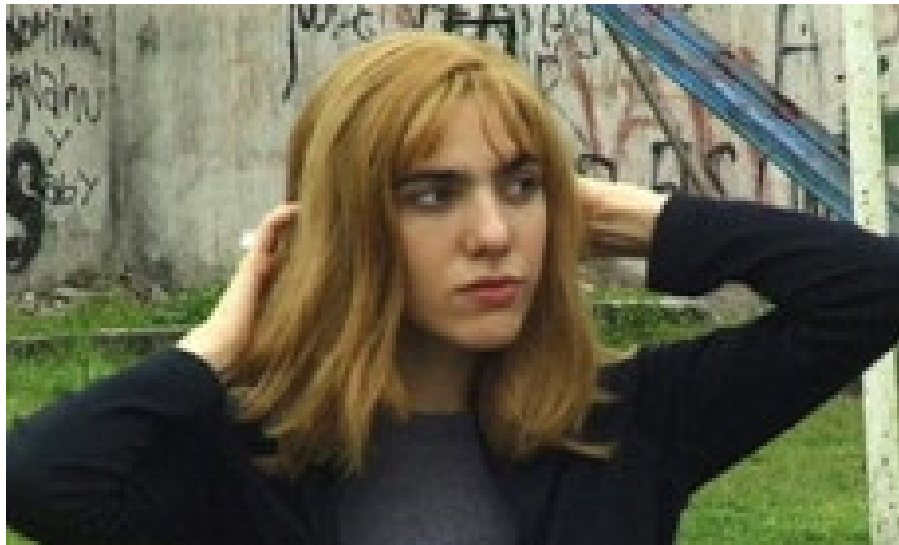
En imagen: Los rubios (2003)