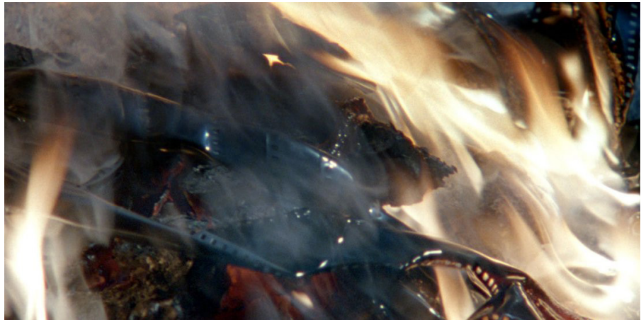
En imagen: Restos (2010)