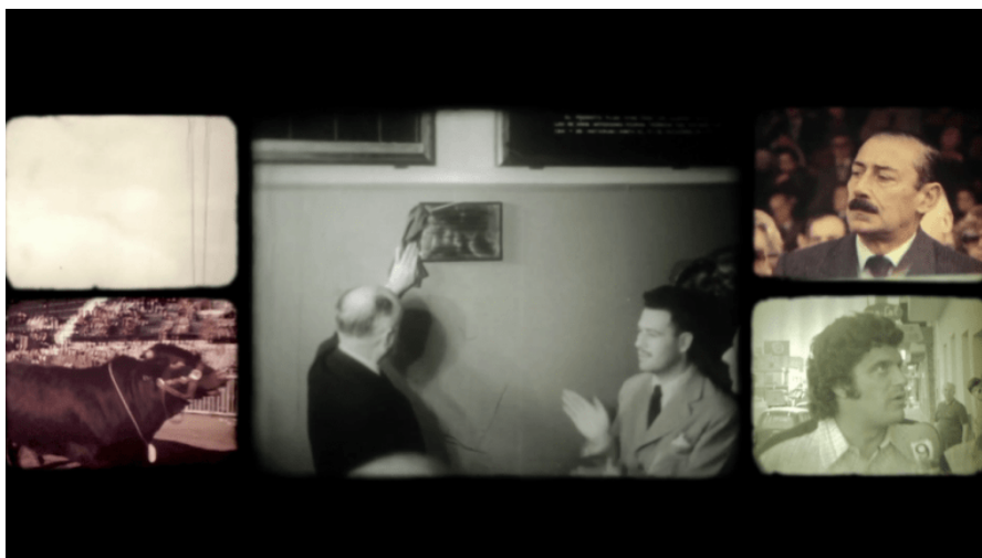
En imagen: Cuatros (2016) – Fuente: http://www.conlososajabiertos.com/cuatros/