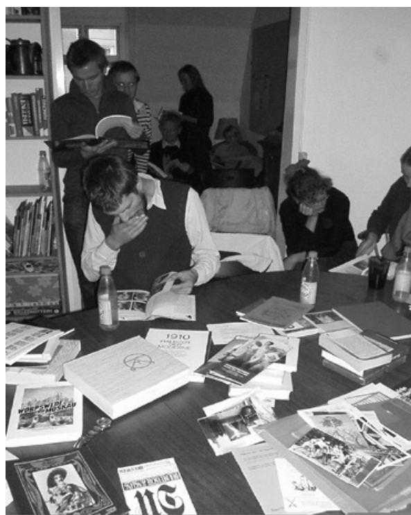
Fig. 3. Salón. Universidad Libre de Copenhague.