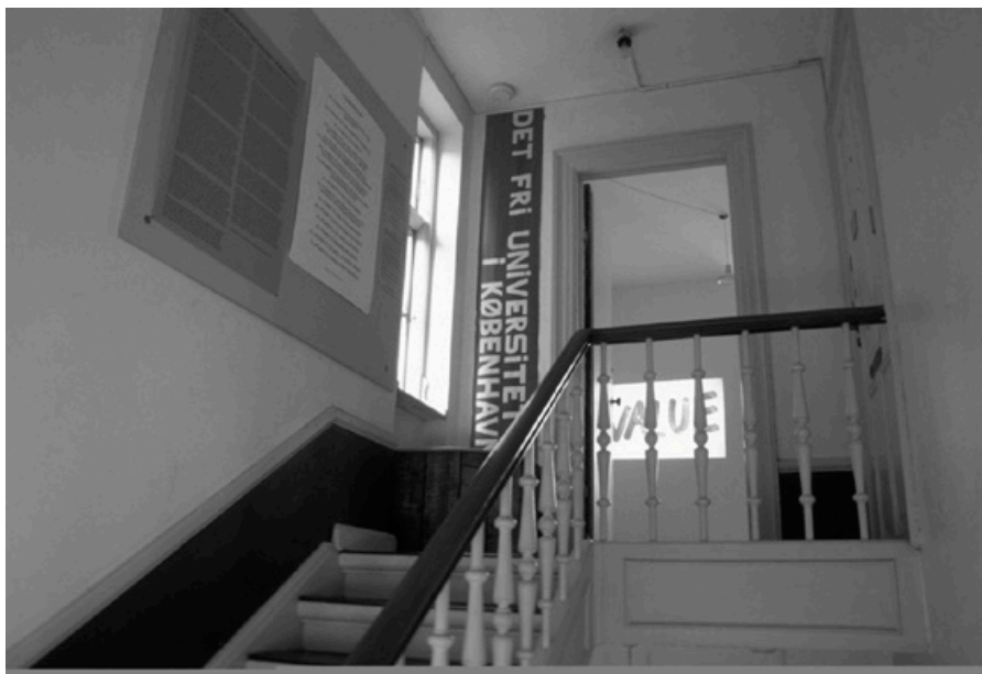
Fig. 1. Entrada. Universidad Libre de Copenhague.