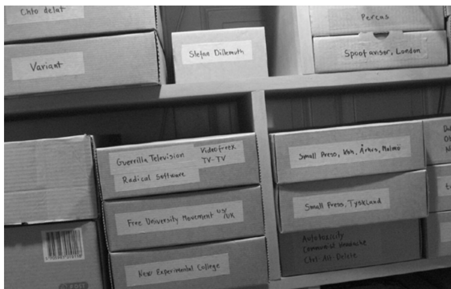
Fig. 2.