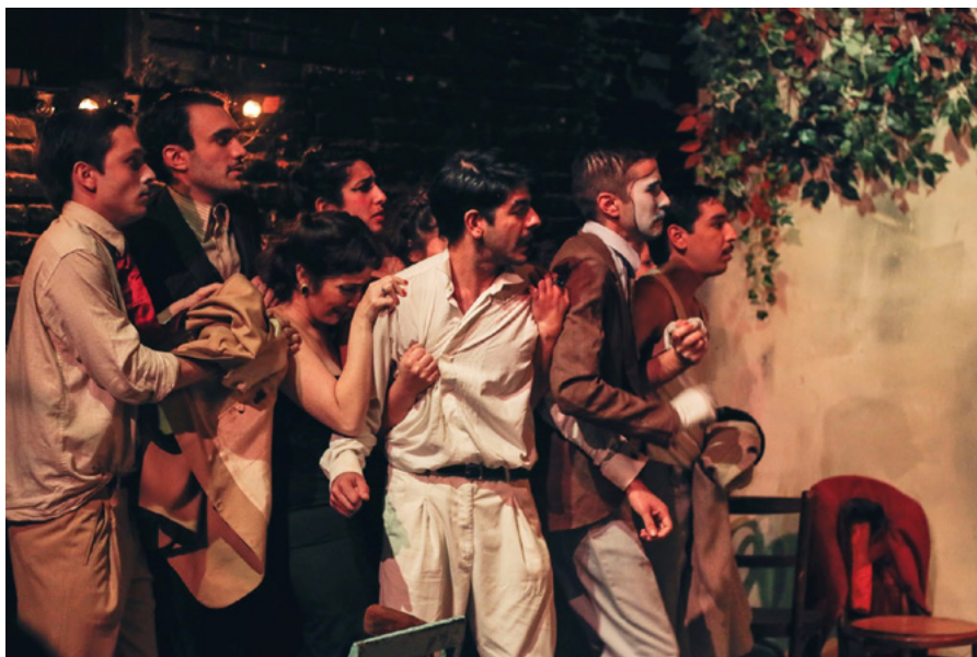
1. La rascada, foto de Gastón Ferrera.

ese pequeño escenario dentro del escenario mismo que los propios personajes mueven hacia el espectador a la hora de realizar sus números . Más adelante se ahondará en este teatrillo escenográfico que corporaliza la metateatralidad de la obra en cuestión. Por último, los sistemas expresivos corporales quizás son los más importantes de toda la puesta en escena, ya que trabajan indiscerniblemente con el lenguaje verbal, y su enfatización mediante lo gestual. Tal como plantea Barthes ( Trastoy y Zayas de Lima ; 2006), la simbolización mimética de la diégesis dramática, es decir, la gestualidad remite siempre a la fábula. En este caso, la gestualidad exageradamente medida refuerza la relación intertextual con el teatro popular argentino, cuyos modos eran exacerbados provenían del circo criollo y del cine mudo.