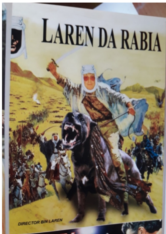
“Laren da Rabia, dirigido por Bin Laren”.