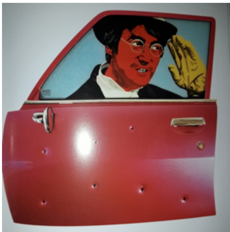
"La puerta Bony ta" (2003)