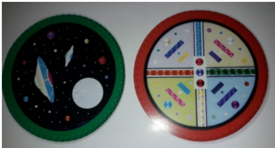
Imagen ruedas de bicicletas

un traje blanco con charreteras y entorchados, similar al de otro rey, Elvis Presley. Laren reforzó así la invención de una autoficción tan estrafalaria como su propia estética. Literatura, fotografía, escultura, collage, música, canto, baile, actuación televisiva, performance, instalaciones, videoarte y guión cinematográfico son las disciplinas de las que Laren se valió para crear un estilo personal de sesgo camp y humorístico, que denominó Pop OhArt y que se caracteriza por el empleo de materiales inusuales -vidrios esmaltados, espejos, monedas, hologramas, papeles metálicos, brillantina, resinas de fabricación propia, y de soportes también infrecuentes, como ruedas de bicicletas, latas de galletitas, matafuegos, ruletas de casino, celulares, puertas de autos y raquetas.