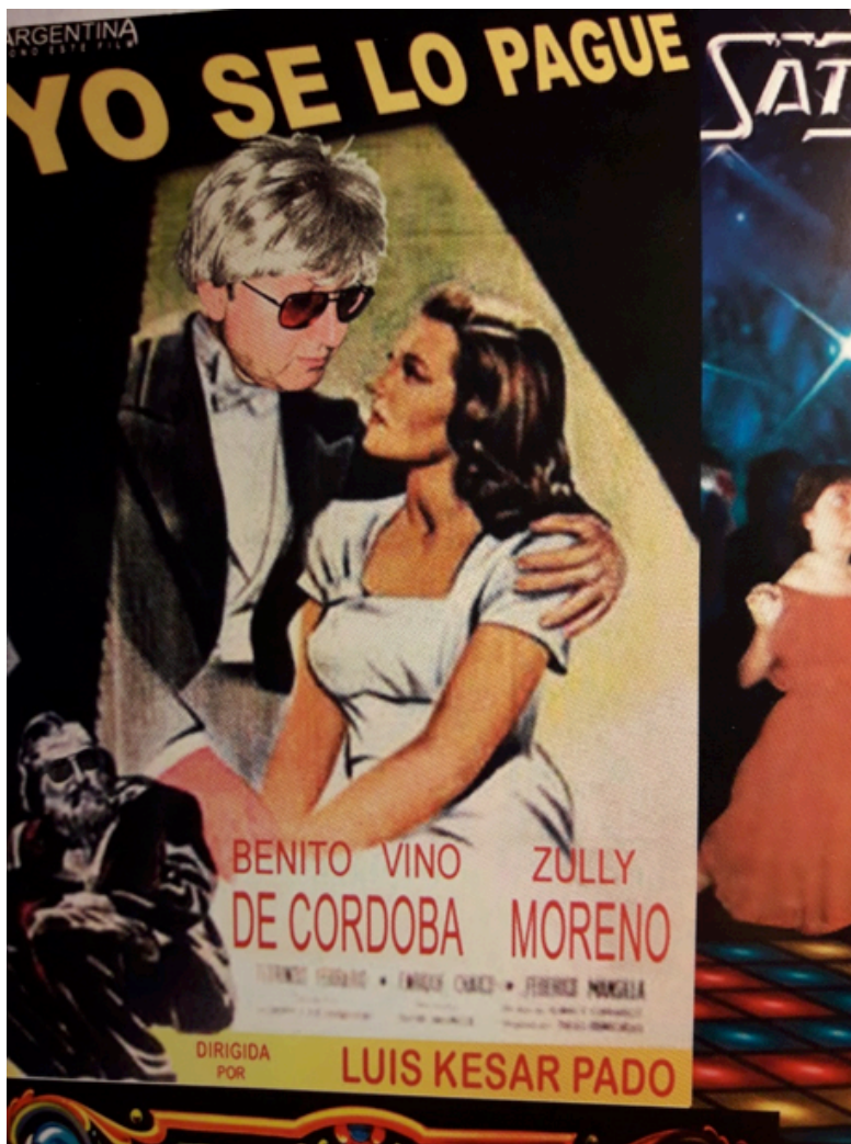
“Yo se lo pague”

Por otro lado, la función didascálica se verifica también a través de la intertextualidad visual de intencionalidad paródica, con respecto a la obra de artistas célebres como Van Gogh, Munch, Warhol, Lichtenstein, Picasso o nuestros más cercanos Cándido López, Xul Solar, Antonio Berni, León Ferrari, Guillermo Kuitca, entre muchos otros, algunos de cuyos personajes encarna con su propio rostro (tal es el caso de la madre costurera de “Primeros pasos” de Berni), así como también intertextualidad con otras disciplinas artísticas como la música popular, el cine o la televisión.