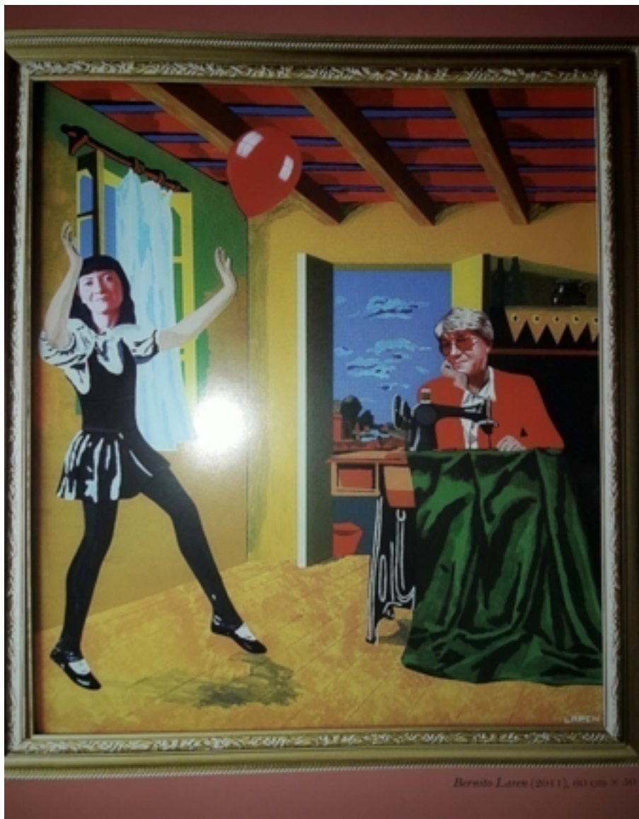
“Benito Laren” (2011)

Un buen ejemplo de esta mutua función didascálica reforzada por el humor verbal y la intertextualidad paródica es la pintura que reproduce el dormitorio de Arlés de Van Gogh, invertido especularmente según la técnica de cuadrejización antes comentada y con una estética que recuerda el estilo de Lichtenstein. Cómodamente recostada sobre la cama, la maja desnuda goyesca devuelve la mirada al observador, haciendo que el título del cuadro –“¿Qué hace usted aquí?”– sea la pregunta que especularmente se formulan entre sí personaje y espectador.