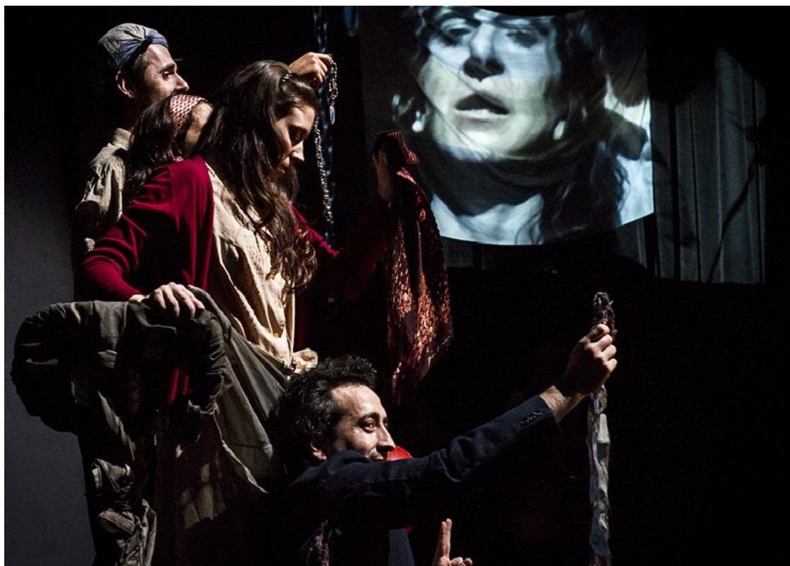
Museo Ezeiza

dentro de “un teatro que reflexiona en torno a los modos de representar (conocer) la realidad y sus distintas formas de percepción, para terminar cuestionando, no ya la posibilidad de la representación sino del propio estatus de la obra teatral” 8 . De este modo, al teatralizar el proceso de generación de la historia, mostrando los mecanismos materiales y concretos que subyacen a su producción, la obra no hace más que reflexionar sobre su propia condición escénica, señalando su dimensión procesual y performática.