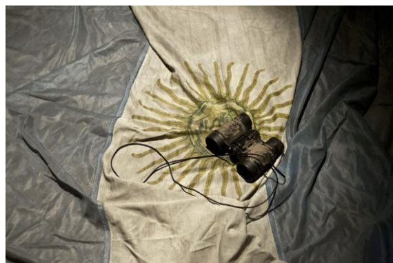
Museo Ezeiza

Teniendo presente este marco conceptual, consideramos que la propuesta de Museo Ezeiza consiste en insertar al discurso histórico dentro de una práctica escénica posdramática. Esta superposición permite reflexionar sobre: