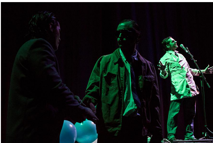
Museo Ezeiza - Foto: Matias Barutta

La forma poética permite que los límites entre el espectador y el actor se diluyan a partir de un vínculo que hace de la recuperación del acontecimiento histórico una experiencia colectiva.