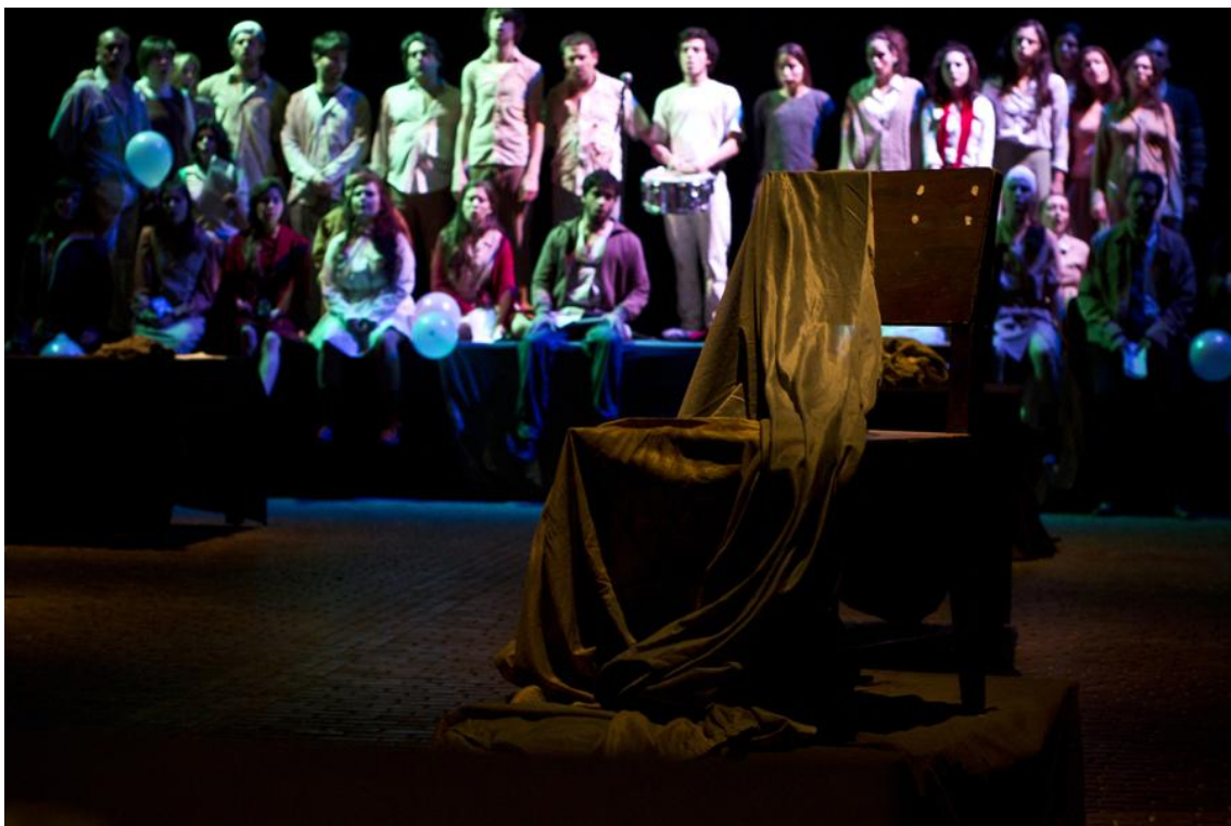
Museo Ezeiza

En su proceso de creación, el actor traduce en un acto poético las vidas que participaron de la masacre. En esta traducción se pone en juego la implicación ética del actor que, como ya hemos indicado, no sólo se encarga de representar al personaje sino que también es creador de su ficción. Su poética resultante no tiene una finalidad pedagógica que pretenda informar o transmitir una verdad sino que, desde su forma poética, apela al imaginario del espectador y construye una memoria colectiva.