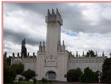
Municipalidad de Rauch