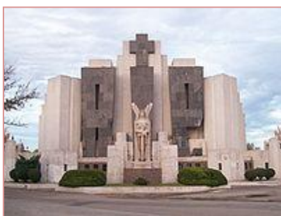
El Cementerio de Azul.

saber la dirección tomamos un camino interno que terminó llevándonos a un edificio increíble. Tiempo después supe que era la entrada del cementerio. Se trataba de un pórtico impresionante, muy alto, y con una figura que horrorizaba un poco. Imponente. Enorme, al menos para el llano de la provincia y mis pocos años.