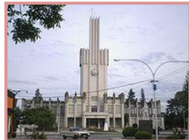
Municipalidad de Coronel Pringles.

Francisco Salamone fue un constructor siciliano que trabajó en la pampa durante unos pocos años, que le bastaron para construir una gran cantidad de edificios. Más de 60 en más de 20 pueblos. Fundamentalmente: Municipalidades, Cementerios y Mataderos.