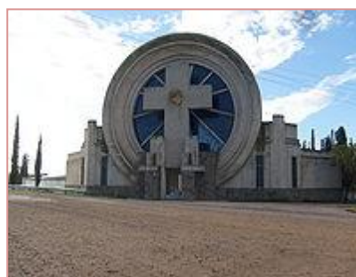
El cementerio de Saldungaray.

Es un hecho sabido que la historia se cuenta en los intersticios, (así como sólo en los intervalos puede darse el movimiento).