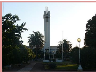
Municipalidad de Tornquist

Así que el puente entre estos signos de resistencia, de sobrevivencia a las imposiciones del tiempo y la naturaleza, lo que hay en común en ambos, es la presencia de Francisco Salamone.