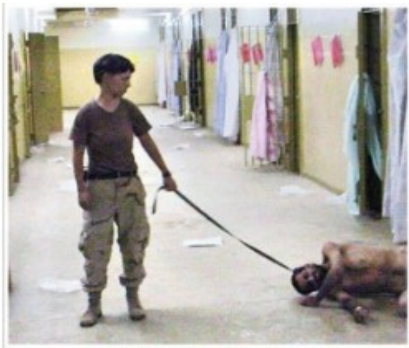
Exclusive to The Washington Post