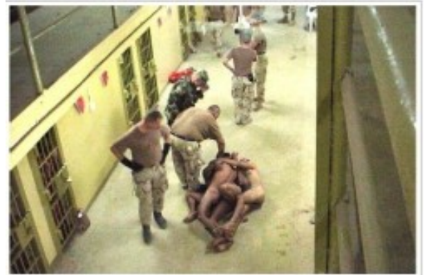
Exclusive to The Washington Post