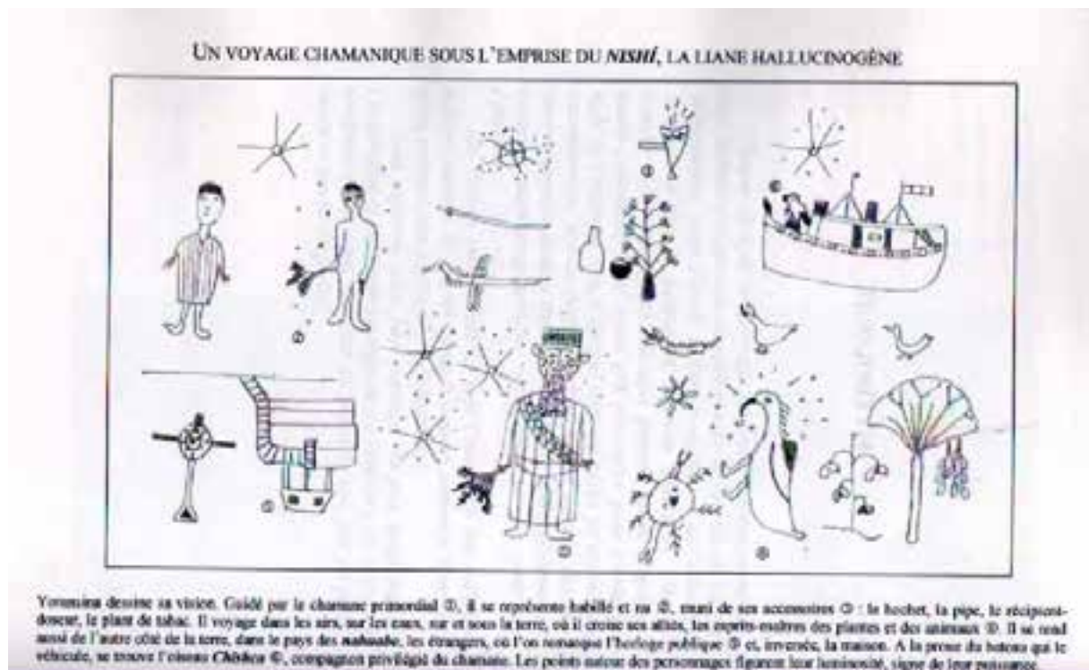
Lámina 2. Yoransina. Mito shipibo: el Acurón.

y su significación se transforman, se politizan [...], se historizan” (34-35, n. 26), un poco a la manera indicada por Carlo Severi en su magnífica obra dedicada a los indios kuna: La memoria ritual: locura e imagen del blanco en una tradición chamánica amerindia .