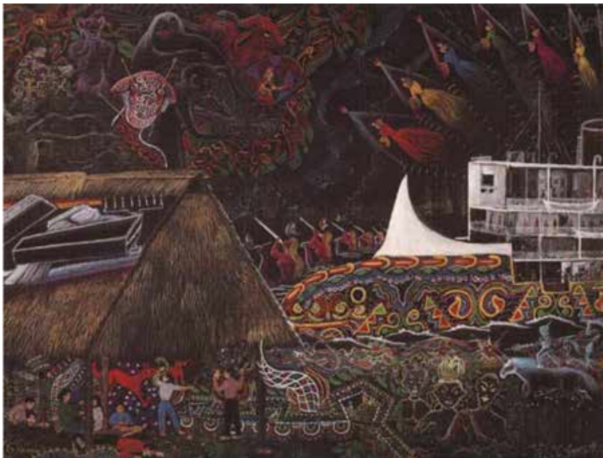
Lámina 4. Pablo Amaringo. Lucha del Aceropunta.

siempre ando como una persona pobre, con estas ropas, esta túnica de algodón. Estas ropas”. Finalmente, el tema de la abundancia, de la riqueza, de las ropas y las mercancías que traerá el steamboat , sí representa en el fondo el fin de la miseria y la esclavitud, como una utopía: